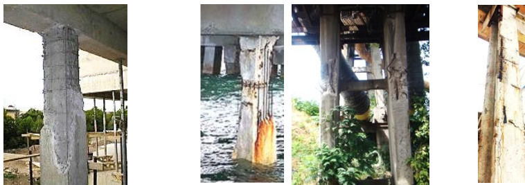
Рис. 1. Руйнування бетону в стиснутих елементах

В процесі експлуатації усі будівельні конструкції зношуються та втрачають свої експлуатаційні якості. Конструкції споруд через активний вплив оточуючого середовища (поперемінне заморожування-відтавання, агресивний вплив газів повітря тощо), механічні пошкодження отримують часткові руйнування частини бетонного перерізу та корозію арматури (рис. 1).