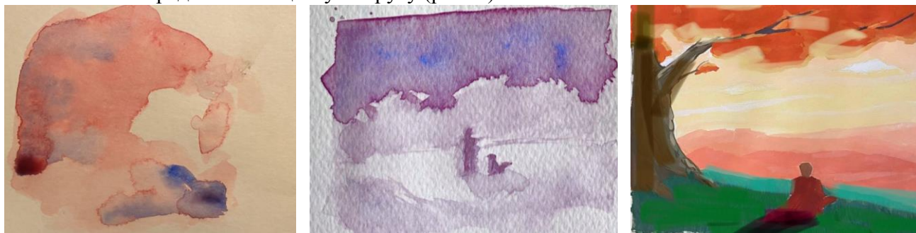
Рис. 3. Етапи трансформації абстрактної плями у образну композицію.

Перевага цього у тому, що розробка композиції вже намічається й у колірному рішенні, максимально передаючи емоційну напругу (рис. 3).