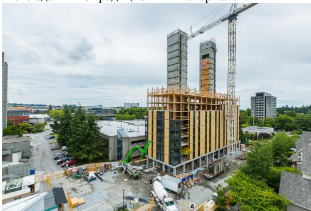
Рис. 4. Монтаж конструкций здания

Также подсчитано, что при строительстве общежития в атмосферу выброшено на 2432т меньше углекислого газа, чем при возведении аналогичного здания из традиционных материалов.