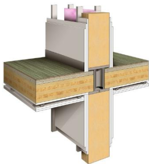
Рис. 3. Соединительная деталь из стали на пересечении пола и колонны

на 70% состоит из декоративного древесного волокна.