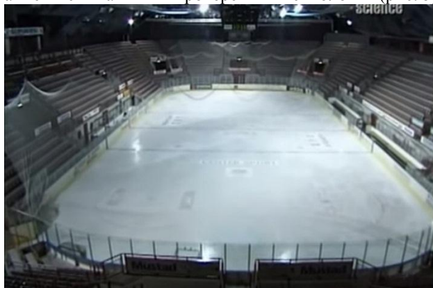
Рис. 5. Подземный стадион на 5800 человек

Спортивный зал внутри горы в Гьовике одно из самых невероятных достижений европейского гражданского строительства. Этот каток находится в самой большой пещере в мире из тех, что открыты для публики. Есть что-то магическое в том, чтобы пройти по туннелю в этот огромный зал. Он вмещает в себя 5 800 человек, и находится на глубине 50м от поверхности горы. Стадион достаточно широк, к примеру, для футбольной подачи, и достаточно высок, чтобы разместить здесь восьмиэтажный дом [4]. Стадион был построен с использованием испытанных и проверенных технологий (рис. 5).