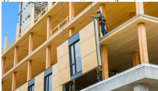
Рис. 2. Монтаж фасада из сборных блоков

Фасад здания выполнен из сборных стальных блоков с предустановленными окнами. Каждый изготовлен из 2-слойных CLT-плит и с внешней стороны облицован искусственным деревом – ламинатом высокого давления Trespa с 70% древесного волокна и термореактивных смол (рис. 2). Все они опираются на колонны из клееного бруса с металлическими соединениями (рис. 3).