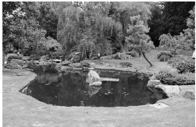
Рис. 4. Сад Фокусіма. Холланд-Парк, Лондон

Територія Дюківського саду також дозволяє втілювати різні стилістичні напрямки ландшафтно-архітектурної архітектури, що безумовно було б елементом тяжіння туристичних потоків.