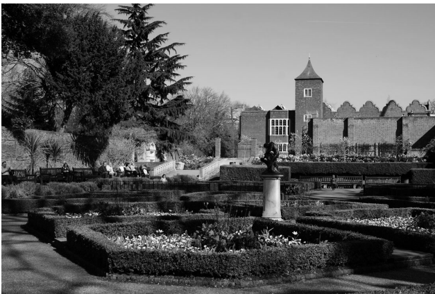
Рис. 3. Будинок сера Холланда

Однією з головних визначних пам'яток парку є сад Фокусіма. Сад відкрився в березні 2011 року: являє собою зелений простір з гальковими доріжками, трав'янистими схилами та традиційними пологими сходами (рис. 4).