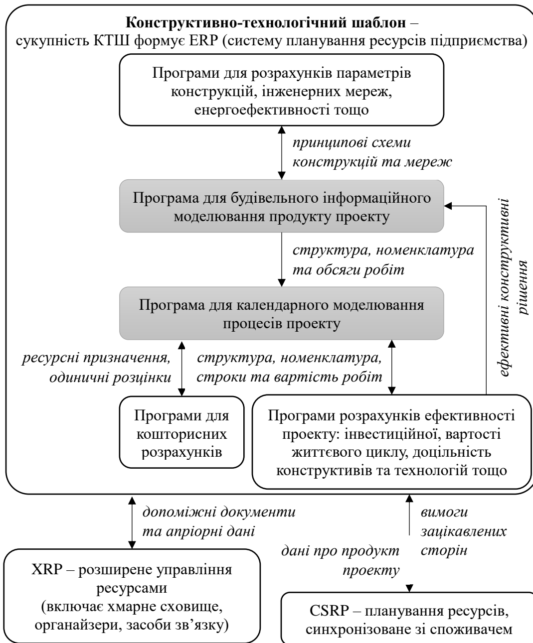
Рис. 1. Взаємодія програмних засобів в рамках концепції «конструктивно-технологічних шаблон у будівництві» (темно-сірим виділено «ядро» КТШ – моделі продукту та процесів проекту; курсивом – інформація, що передається; стрілками показаний напрямок передачі інформації)

протягом всіх етапів інвестиційно-будівельного процесу. Під зацікавленими сторонами на рисунку 3 розуміються як державні органи контролю (відповідність версій КТШ нормативним вимогам, містобудівним вимогам, правилам виконання будівельних робіт, затвердженому експертизою проекту тощо), так і інвестори та кінцеві споживачі будівельної продукції (відповідність версій КТШ перевагам, що важливі для сторін, контрактним зобов'язанням тощо).