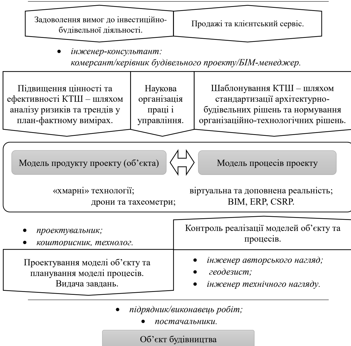
Рис. 2. Принципова схема управління знаннями при використанні інжинірингового підходу та концепції «конструктивно-технологічний шаблон в будівництві»

(примітки: 1 BIM (Building Informational Modelling) – будівельне інформаційне моделювання;