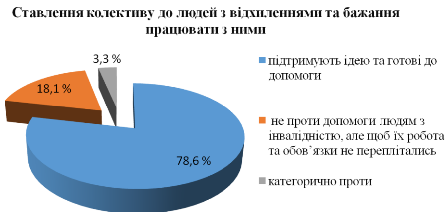
Рис. 1 - Дані анкетування персоналу Алькабір – Строй

прибуток зріс на 165 590,21 грн. Така ситуація пов'язана із прибутковою основною операційною діяльністю. Але при цьому, показники фінансової стійкості Алькабір – Строй все ж такі далекі від оптимального значення, отже у підприємства слабке фінансове становище. Також згідно ст. 19 Закону № 875 для Алькабір – Строй встановлений норматив кількості робочих місць для працевлаштування людей з особливими потребами у розмірі 4% чисельності штату 10 осіб. Поняття «інклюзія» передбачає процес включення у соціальні стосунки усіх громадян, незалежно від їх особливостей [1, с. 153; 4, с. 41]. Обґрунтування щодо впровадження інклюзивного менеджменту Алькабір – Строй є доцільним, так як при умовах інклюзивного працевлаштування роботодавець отримуватиме пільги, зокрема при нарахуванні єдиного соціального внеску, але при відмові в інклюзивному працевлаштуванні на підприємство очікує штраф. Також інклюзивне працевлаштування надасть змогу Алькабір – Строй впровадити соціальну відповідальність та підвищити рівень згуртованості колективу, 78,6 підтримують інклюзивну політику (рис. 1).