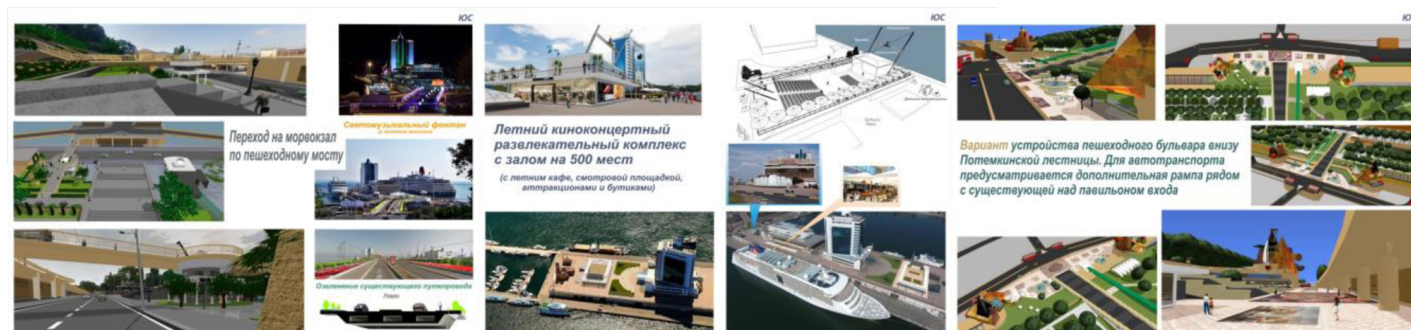
Рис. 2. Конкурсный проект

Сегодня городом предпринимаются определенные шаги для решения этой проблемы: реставрируется Потемкинская лестница, благоустраиваются Стамбульский и Греческий парки, объявлен конкурс на благоустройство открытой территории пассажирского комплекса Одесского морского порта (одной из задач которого является осуществление удобной связи его с Приморским бульваром). На взгляд авторов весь этот комплекс работ должен быть связан единым концептуальным архитектурным проектом . К сожалению Стамбульский парк благоустраивается отдельно, по Греческому парку был проведен городской архитектурный конкурс и определен победитель (но принят к исполнению почему-то не участвующий в конкурсе проект), сейчас проводится конкурс на благоустройство морского вокзала. Команда авторов принимает участие в этом конкурсе.