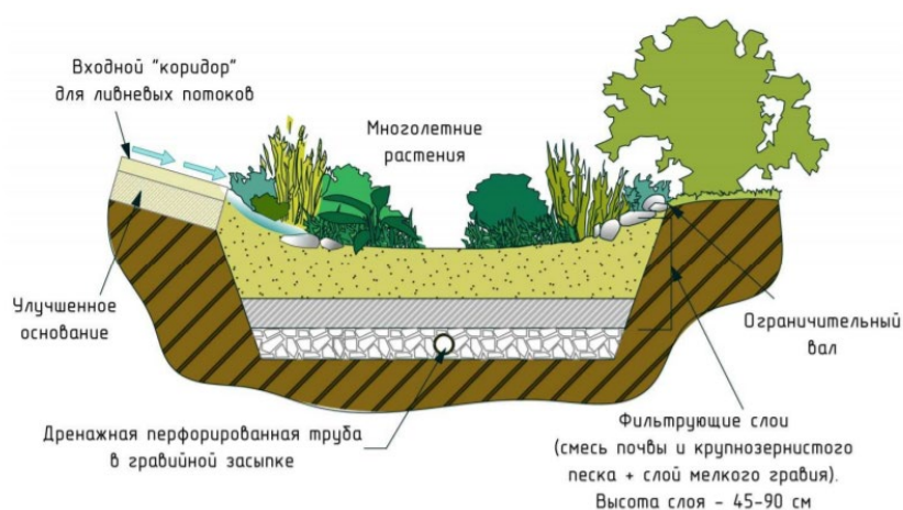
Рис. 1. Схема устройства дождевого сада

Дождевой сад как элемент зелёной инфраструктуры представляет собой пониженную область в ландшафте, где собирается дождевая вода и проходя процесс гидрботанической очистки (фиторемедиация) способствует увеличению биоразнообразия, созданию отдельных биоценозов, где протекают естественные биологические процессы. (Рис. 1).