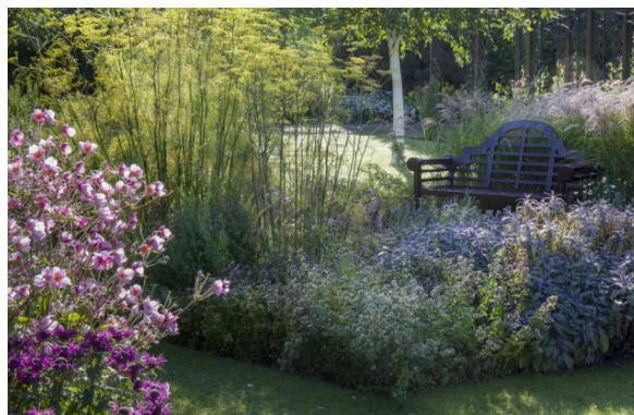
Рис. 5. Дождевой цветник с использованием кустарниковых и древесных растений

В мире дождевые сады как объекты фиторемедиации создаются уже около 40 лет. По всему миру дождевые сады входят в программу устойчивого развития города. Так, в США развиты такие направления как «Экологическое Управление Ливневыми стоками» (Ecological Stormwater Management - ESM), а также «Low Impact Design - LID» (технология экологически щадящего подхода к дизайну территории, цель которого - управление городскими ливневыми стоками). В Великобритании есть похожая программа – «Устойчивые дренажные системы» (Sustainable Drainage Systems SuDS), в Австралии развита технология управления ливневыми стоками «Water Sensitive Urban Design - WSUD». Все эти подходы направлены на создание устойчивой системы городского дренажа, и дождевые сады здесь являются ключевым элементом [3].