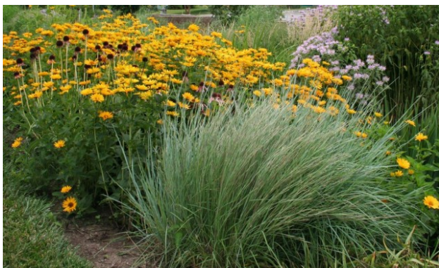
Рис. 4. Дождевой цветник с использованием злаковых и цветущих растений