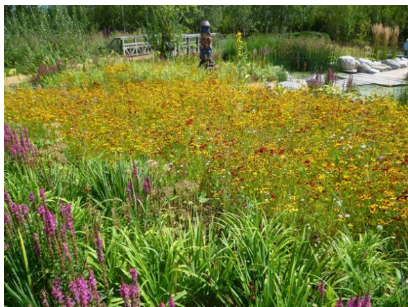
Рис. 3. Дождевой сад, расположенный у водоема

Есть, однако, критерии, которые применяются во всех случаях: