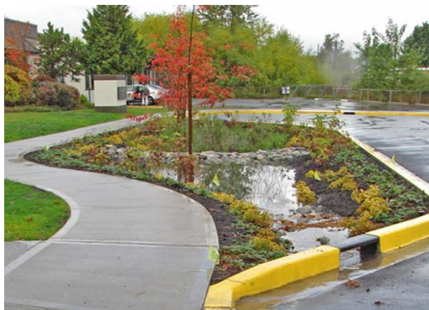
Рис. 2. Дождевой сад, расположенный в городском пространстве