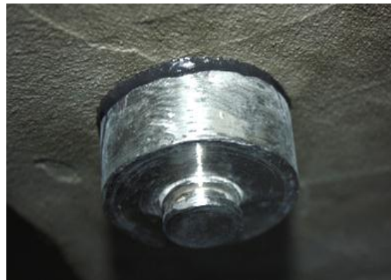
Рис. 3. Вигляд приклеєного циліндра до поверхні гідроізоляції зі щільним швом клею

Кожен приклеєний циліндр позначається шифром, який складається з 3-ох символів – «А.1.1.», де буква вказує на гідроізоляцію: А – AQUAFIN-2К, Т – ТЕРМІТ ТГ-33. Перша цифра – на порядковий номер експерименту, друга цифра – на номер металевого циліндра.