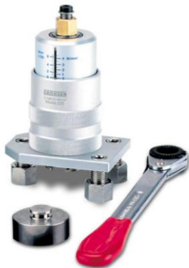
Рис. 2. Зовнішній вигляд адгезиметра ERICHSEN Model 525-B

Методика вимірювання адгезії у залізобетонних зразках в лабораторних умовах. Після 28 діб бетонні зразки, покриті гідроізоляцією різних торгових марок піддавались експериментальним дослідженням вимірювання адгезивної міцності гідроізоляційного покриття. Міцність адгезії вимірювалась методом рівномірного відриву. Для цього використовувався сертифікований адгезиметр ERICHSEN 525-B (рис. 2.), який відповідає стандарту ASTM-D-4541. Вимірювання починалось з приклеювання металевих циліндрів до покриття гідроізоляції (рис. 3). Металеві циліндри діаметром 5 см приклеювались двокомпонентними клеями на базі епоксидної смоли – «Resin 220» і «VersaChem». Клеї були вибрані з міркувань, щоб сила їхньої адгезії була більшою від очікуваної міцності адгезії даних гідроізоляційних покриттів.