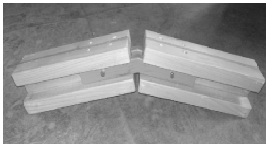
Рис. 1. Вузлове з'єднання зі сталевими трубчастими елементами

У лабораторії дерев'яних конструкцій ОДАБА були проведені випробування складових дерев'яних балок прольотом 2,4 метра різних конструктивних рішень. Перше рішення: клефанерна балка з плоскою стінкою, вкесною в паз полиць з цільної деревини (мал.1); клефанерна балка з плоскою стінкою і з поясами з дерев'яних брусків, приклеєних з боків стінки; клефанерна балка зі стінкою, вкесною в паз полиць з клеєної деревини; складова балка з поясами з дерев'яних брусків, з'єднаних шурупами зі стінкою з OSB. Для досліджуваних складових дерев'яних балок були розраховані теоретичні прогини і максимальні несучі навантаження з використанням існуючої нормативної методики розрахунку по ДБН [1].