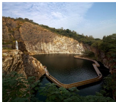
Рис.4. Китай. Шанхай. Ботанический сад Чень Шань. 2010 г. Эко-модернизированный карьер. Проект студии THUPDI Пекинского университета Цзынхуа http://www.abitant.com/posts/botanicheckiy-sad-chen-shan-v-shanhae (Tsinghua University)

О ботаническом саде Чень Шань в Шанхае (рис.4) известно довольно много: «это масштабный пейзажный проект мюнхенского бюро Planungsgruppe Valentien, осуществленный в 2010 году» [11]. Сад расположен на берегу озера Дяньшань, занимает площадь 206 га (насыпная земля в дельте реки Янцзы), кроме научной деятельности активно привлекает туристов. Проект считают эко-инновационным, главной целью проекта была разработка автономной и стабильной экосистемы. Воды реки Янцзы очищают на специально заболоченном участке, после чего используют для полива садов, здания оборудованы энергосберегающими системами, осуществляется экологическая очистка сточных вод. В основу дизайн-идеи проекта легли символика и эстетика традиционного китайского ландшафта. В основу композиции положены три элемента – гора с карьером, озеро или вернее система озер и закольцованный островной участок с садами (35 садов). Заброшенный карьер с обезображенным ландшафтом и разрушенным горным массивом был реконструирован. В результате ландшафтной модернизации ему были возвращены пять «пейзажных достопримечательностей» из восьми, которыми некогда славилась эта часть массива, карьер был «реализован как современный аттракцион для экологического трекинга» [12].