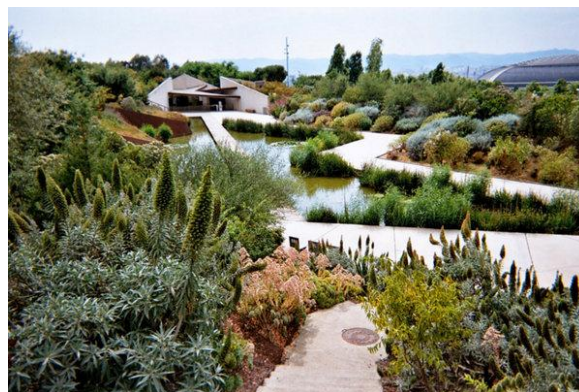
Рис.1. Испания. Барселона. Jardí Botànic de Barcelona. http://www.nb-garden.ru/public/pub24/public_24_1.html

В мировой практике проектирования современных ботанических садов есть примеры, когда ботанические сады устраиваются на местах карьеров по добыче природных ископаемых. Это даже символично, когда на месте карьеров, разрушающих ландшафт, наносящих удар по окружающей среде и экологическому фону местности, появляется ботанический сад, миссия которого, кроме всего прочего, связана с вкладом в формирование здоровой, безопасной окружающей среды.