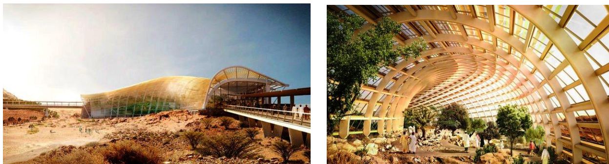
Рис. 6. В скором времени в Омане будет создан самый большой ботанический сад в мире – он займет больше 420 гектаров. В разработке проекта принимают участие три бюро: Grimshaw, Haley Sharpe Design (hsd) и Arup. https://pragmatika.media/news/samyj-bolshoj-botanicheckij-sad-mira-v-aravijskoj-pustyne/

Пожалуй, крупнейшим ботаническим садом на постсоветском пространстве является ботанический сад в Астане (около 97 га). Общую концепцию ботанического сада Астаны разрабатывали архитектор Абеллонно Пьер Андрэ из Италии и ландшафтный дизайнер Жан Мусс из Франции, курирует проект знаменитый испанский архитектор Карлос Ферратер [13]. Функция ботанического сада в Астане не ограничивается только научной, учебно-просветительской и экологической деятельностью. Кроме уникальной научной зоны с двумя крытыми оранжереями, предусмотрена парковая зона с комфортными условиями для отдыха, с искусственными водоемами, беговыми и велодорожками, двумя ресторанами, двумя кафе и детскими учреждениями. Основной принцип, по которому проектировались архитектурные объекты на территории сада, – это единение с природой. «По словам специалистов из проектной фирмы, один из основных замыслов архитектурно-планировочной идеи – размещение в экспозиционной зоне восьми больших прозрачных, разных по размеру полусфер-оранжерей, которые между собой соединяются крытыми пешеходными переходами» [14]. Композиция плана сада относится к регулярному типу, можно даже сказать, к его классическому варианту с привнесением традиционных для казахского орнамента мотивов (рис. 5)