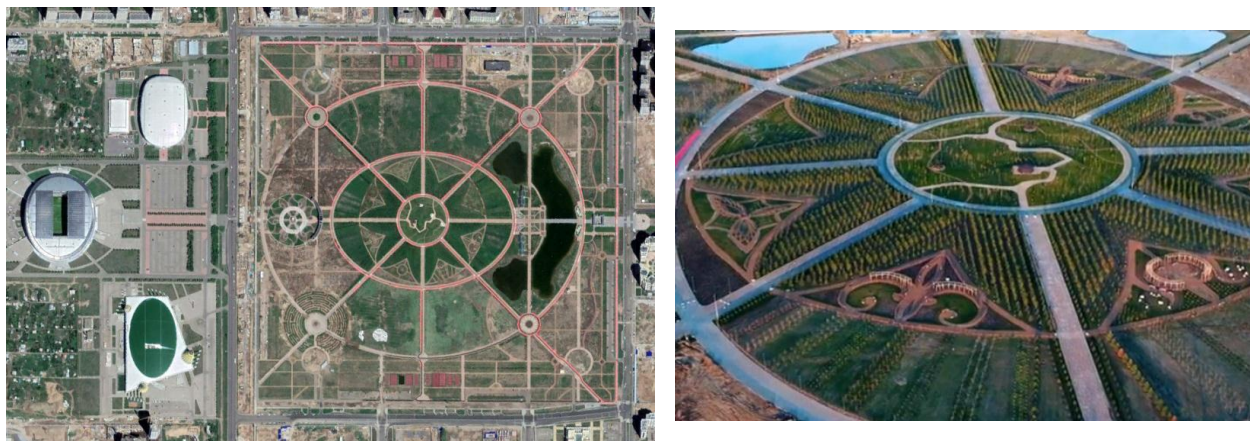
Рис.5. Казахстан. Астана. Ботанический сад. https://www.google.com.ua/maps/place/ https://www.inform.kz/ru/botanicheckiy-sad-v-astane-pokazali-s-vysoty-ptich-ego-poleta_a3269270

Пожалуй, крупнейшим ботаническим садом на постсоветском пространстве является ботанический сад в Астане (около 97 га). Общую концепцию ботанического сада Астаны разрабатывали архитектор Абеллонно Пьер Андрэ из Италии и ландшафтный дизайнер Жан Мусс из Франции, курирует проект знаменитый испанский архитектор Карлос Ферратер [13]. Функция ботанического сада в Астане не ограничивается только научной, учебно-просветительской и экологической деятельностью. Кроме уникальной научной зоны с двумя крытыми оранжереями, предусмотрена парковая зона с комфортными условиями для отдыха, с искусственными водоемами, беговыми и велодорожками, двумя ресторанами, двумя кафе и детскими учреждениями. Основной принцип, по которому проектировались архитектурные объекты на территории сада, – это единение с природой. «По словам специалистов из проектной фирмы, один из основных замыслов архитектурно-планировочной идеи – размещение в экспозиционной зоне восьми больших прозрачных, разных по размеру полусфер-оранжерей, которые между собой соединяются крытыми пешеходными переходами» [14]. Композиция плана сада относится к регулярному типу, можно даже сказать, к его классическому варианту с привнесением традиционных для казахского орнамента мотивов (рис. 5)