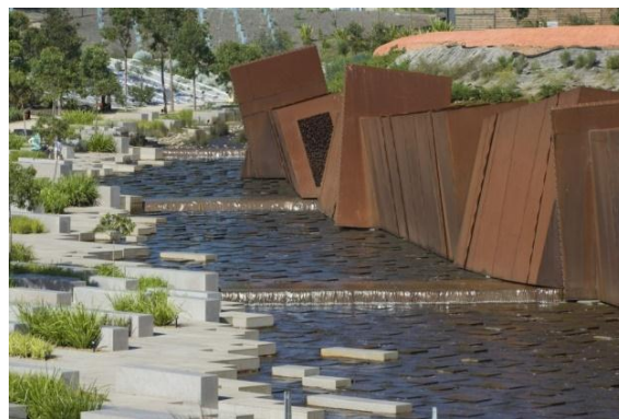
Рис.3 Австралия. Ботанический сад в Кранборне. Национальная награда ландшафтной архитектуры 2014 года: дизайн. Тейлор Каллити Летлин и Пол Томпсон https://architectureau.com/articles/2014-national-landscape-architecture-award-design-australian-garden/