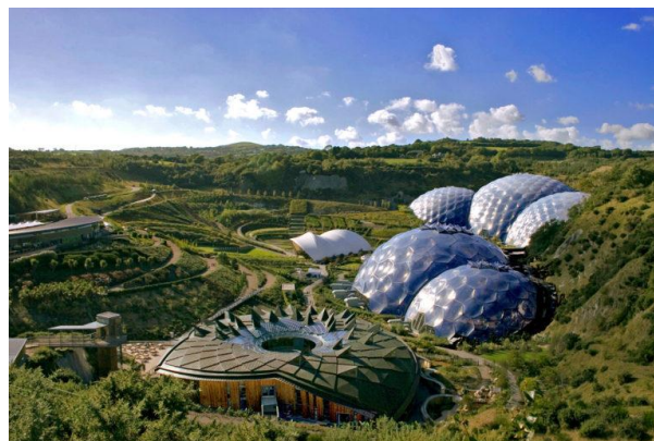
Рис.2. Великобритания. Корнуолл. Ботанический сад «Эдем». https://tranio.ru/articles/eden_project/ , https://www.google.com.ua/maps/place/

В дизайне средневропейского биома использованы скульптурные изображения гигантских насекомых, которые выявляют ключевые точки в построении экспозиции (участок растений-медоносов – гигантская пчела, участок водных растений – водомерка) и являются символами места, наряду с другими скульптурами, присутствующими в «Эдеме». В специфической среде «Эдема» запроектировано множество познавательных объектов и инсталляций, которые представляют интерес для детской аудитории.