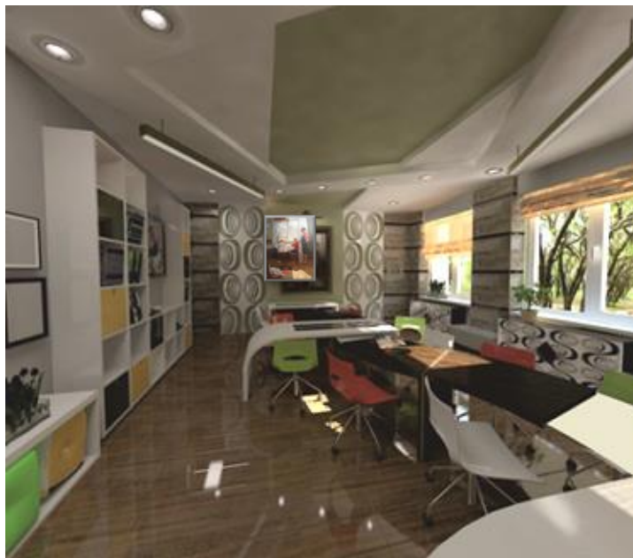
Рис.5. Интерьер учебного класса