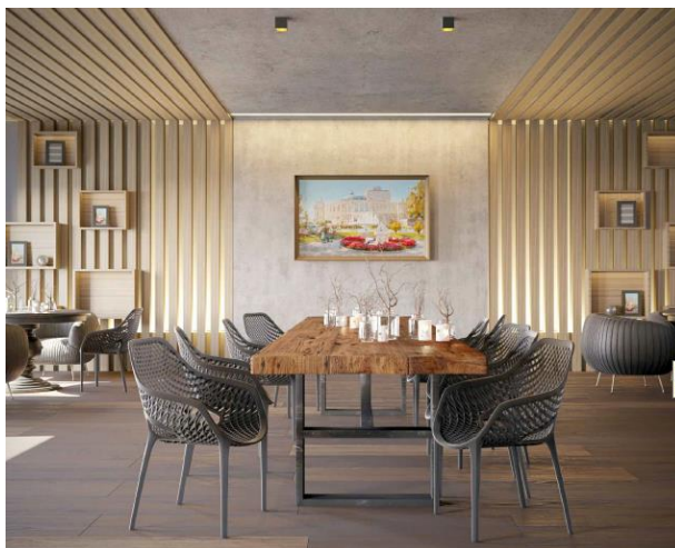
Рис.2 Божко Е. Тематическая композиция «Бабье лето» в интерьере кафе «Осень»

Главной задачей создания интерьера, является гармоничное размещение и акцентирование внимания на данной работе. Произведение должно стать основным эмоциональным элементом интерьера. Исходя из этого, выбирается наиболее доступное и освещенное место, где можно сосредоточить все внимание на выбранном произведении. Если необходимо внести определенные изменения, делается перепланировка, в пределах допустимых строительных и нормативных актов, с учетом специфики помещения. Большое значение для эмоциональной составляющей интерьера, является сознательное применение средств и законов композиции. Одними из них являются контраст и нюанс. Так, располагая художественное произведение в интерьере, дизайнер намеренно может использовать контрастные сочетания цвета, фактуры и текстуры стен, приемы искусственной подсветки картины, создавая тем самым акценты и доминанты, вызывающие бурный эмоциональный отклик у зрителя.