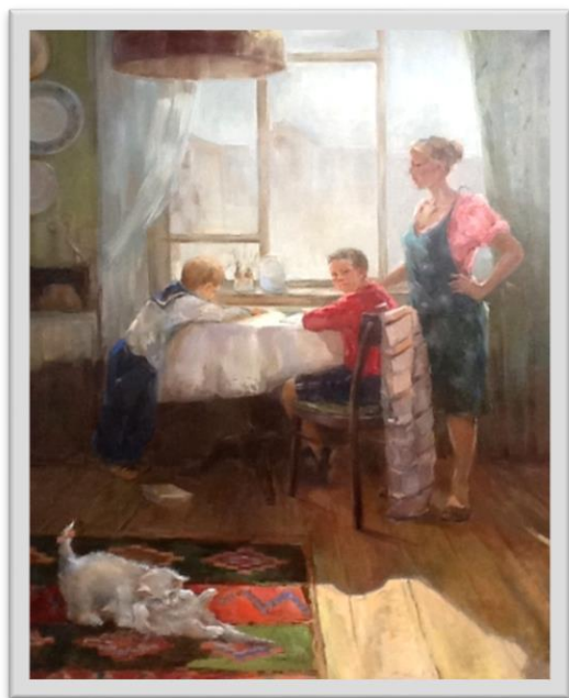
Рис.4. Г.Л. Рахубенко. «Семья» х.м.