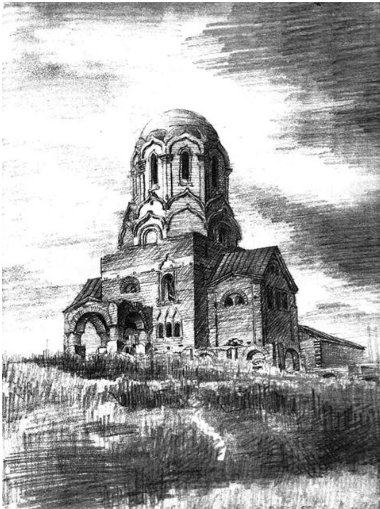
Рис. 2. Недобудований храм пам'ятник в ім'я Святого чудотворця Миколая на Звіринці у Києві. Малюнок В. А. Куцевича. Початок 50-х років XX ст.