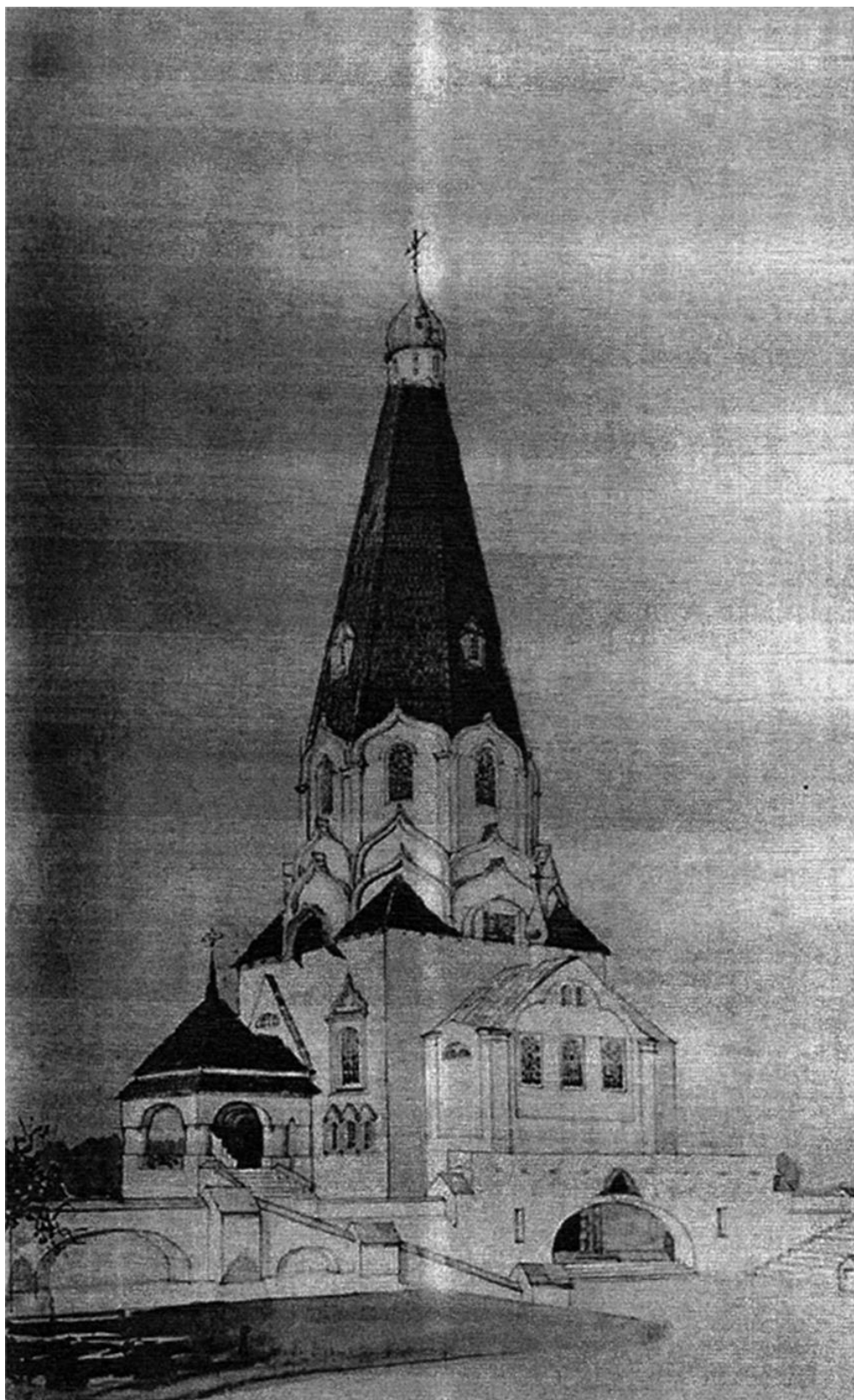
Рис. 1. Проект храму пам'ятника в ім'я Святого чудотворця Миколая на Звіринці у Києві. Головний фасад