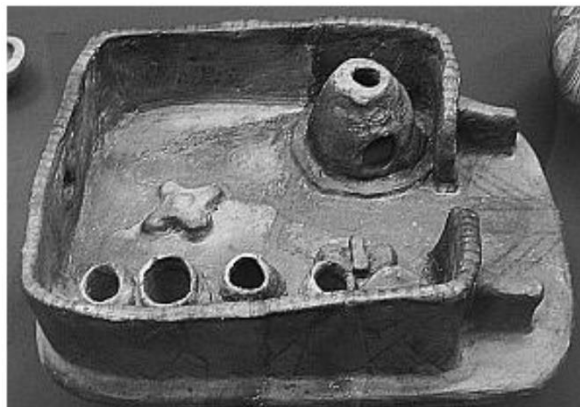
Рис.1. Керамічна модель трипільського будинку. 6-3 тис.до н.е.

Саме слово «макет» походить від французького – «maquette» і від італійського – «macchietta» і означає просторове зображення чого-небудь, зазвичай в зменшених розмірах. Одними из стародавніших макетів, що збереглися вважаються трипільські макети житлових (Рис.1) і культових споруд (Рис.2). Виявлені в розкопках на території України вони датуються шостим – третім тисячоліттям до нашої ери. Вони передавали зовнішній вигляд споруди з її вертикальними стовпами або з гладкими писаними стінами, іноді зображували інтер'єр будинку з піччю, лавками і навіть начинням.