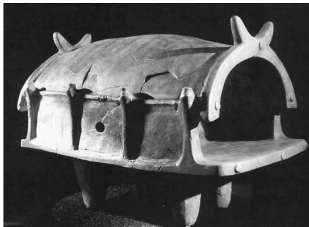
Рис.2. Керамічна модель трипільського храму. 6-3 тис.до н.е.