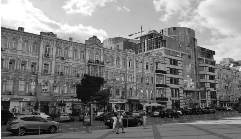
Рис. 6 Бізнес-центр «Сіті Плаза», 2003 р., арх. О. Донец

історичного минулого тільки підкреслюючи її чужорідність. (Див. рис. 6)