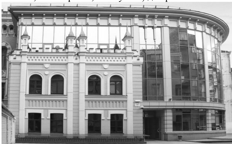
Рис. 5 Адміністративна будівля, 2013 р., гол. арх. О. Коваль

Гармонійний результат вписаного нового архітектурного об'єкта в історичне середовище за принципом контрасту досягнутий також у проекті адміністративної будівлі по вул. Інститутська 11-б, побудованого в 2013 році (авторський колектив: ГАП О. Коваль, арх. О. Сокіл, Н. Поправка, О. Шутова) див рис. 5.