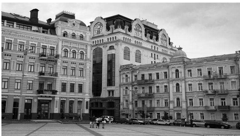
Рис. 1 Адміністративна будівля, 2010 р., Архітектурне бюро «Смирнов і К°»

Ще одним вдалим прикладом є будівля офісно-торговельного центру на вул. Верхній Вал 68, виконана за проектом Архітектурного бюро «О. Коваль» (у складі ВАТ «Київпроект»). (Див. рис. 2)