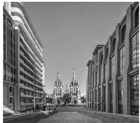
Рис. 3 Готельно-офісний комплекс «Торонто-Київ», 2005 р. – 2013 р., арх. А.В. Пашенько.

Використовуючи відповідні об'ємно-просторові рішення та враховуючи принцип обмеження поверховості, проектувальник досяг завданої мети: з пішохідної зони загальноміської групи забезпечений повний огляд архітектурного акценту найближчого середовища – Миколаївського костелу (наразі Дім органної та камерної музики). Стилiстичне