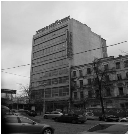
Рис. 7 Будівля Республіканського «Будинку моделей» (зараз будівля Укргазбанку), 1969 р., функціоналізм

Прикладом невдалого вторгнення в історичну забудову може також служити будівля Республіканського «Будинку моделей» Міністерства побутового обслуговування населення УРСР, побудована в 1969 році (зараз будівля Укргазбанку) за адресою вул. Вел. Васильківська, 39 (рис. 7).