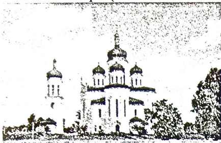
Рис.1. Троицкая церковь в жилом массиве «Троица» в г. Киеве

Примерами современных православных храмов является Троицкая церковь (жилой массив «Троица» в г. Киев) (рис. 1), церковь Покрова Божьей Матери (жилой массив «Оболонь» в г. Киев) (рис. 2).