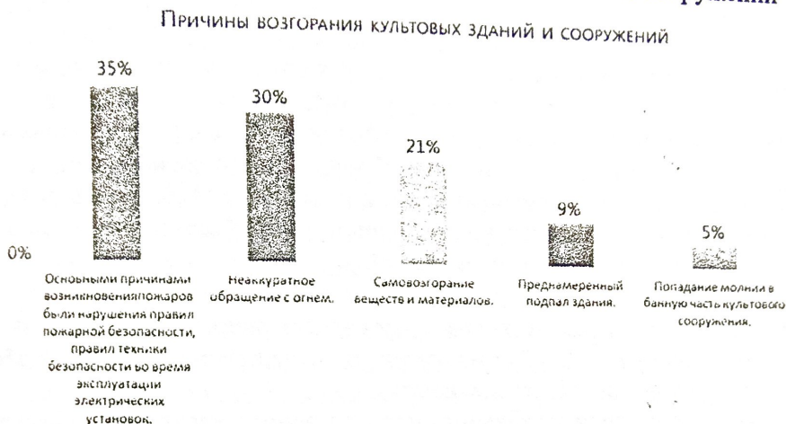
Таблица 3. Причины возгорания культовых зданий и сооружений

Касательно требований по проектированию общественных зданий и сооружений, в том числе, культовых сооружений, лишь в пункте 17, ДБН В.2.5-13-9 изложены требования к проектированию сооружений, которые нуждаются в оборудовании автоматическими установками пожаротушения и пожарной сигнализации. Согласно с этими требованиями все помещения культовых сооружений площадью, порядка, 500 кв.м. оборудуются автоматическими устройствами пожаротушения. Помимо этого, алтарь, помещения для обрядов, залы для молитвы площадью на более 400 человек оборудуются автоматическими устройствами пожаротушения. Для внутреннего тушения бань, выполненных из легко воспламеняемых материалов, применяют системы полива.