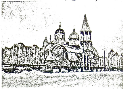
Рис.2. Церковь Покрова Божьей Матери в жилом массиве «Оболонь» в г. Киеве

Культовые сооружения принадлежат к пожароопасным сооружениям и являются объектами с массовым пребыванием людей. Такие сооружения являются культурной, исторической, духовной ценностью народа. Особенности зданий подобного типа в плане пожарной безопасности, является то, что в них, зачастую, используется открытый огонь в виде свечей, факелов, светильников, как одних из сопутствующих культовых атрибутов вероисповедания. В подобных сооружениях часто предусматриваются подземные помещения со сложным планировочным решением, исключающим системы вентиляции и мер по защите от дыма [1-12]. Ко всему прочему, религиозные каноны и традиции направлены на возведение культовых центров исключительно из природных материалов. Самым часто используемым материалом со времен Киевской Руси считалась древесина. Пожары, возникающие в старых сооружениях, памятниках архитектуры, возведенных из древесины, приносят как материальные, так и культурные убытки стране и социуму.