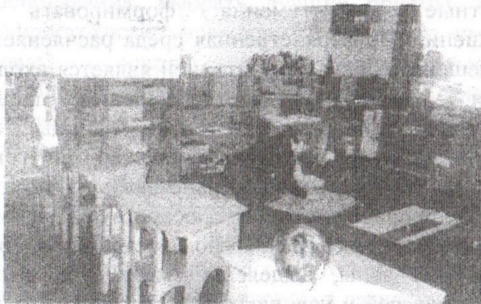
Рис.2 Детский сад №75 в Одессе

разнообразными дидактическими играми. Игрушки здесь заменены специальными обучающими играми, выстраивающимися в стройную педагогическую систему [2,4,5].