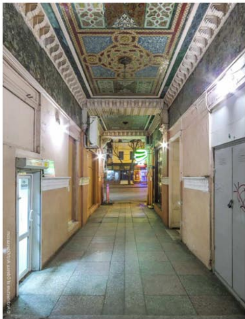
Проходная арка со стороны Дерибасовской

Внутренний объём арки разделён балкой на две неравные части, опирающейся на широкие кронштейны, декорированные лепной стилизацией арабской резьбы по камню.