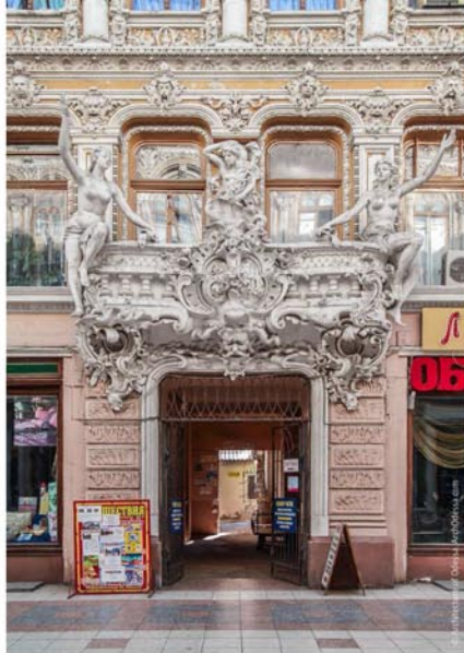
Лепные балконы и их декор

Интенсивность отделки на втором этаже резко возрастает по сравнению с первым и третьим.