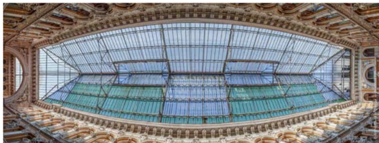
Фонарь большого зала

Оригинальное остекление давно утрачено, однако конструкция фонарей сохранена без изменений. В месте схождения галерей образован квадратный объём, перекрытый третьим фонарём аналогичной формы. Объём этот отделён от каждой галереи огромной аркой во всю высоту здания, а в его срезанных углах расположены ниши (вероятно, предназначавшиеся для ваз или светильников).