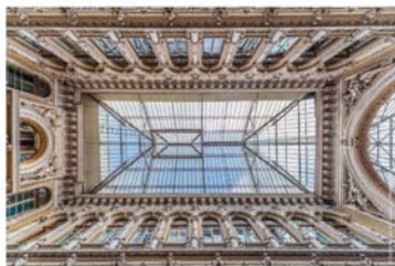
Фонарь малого зала