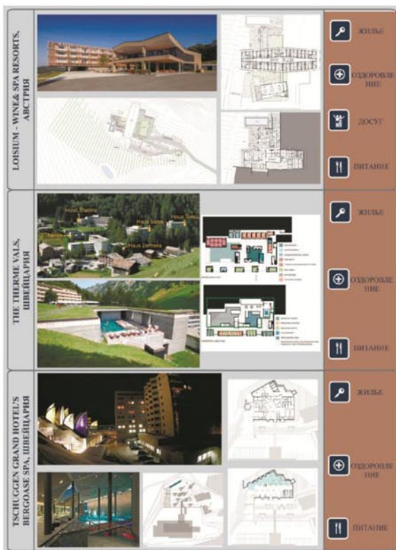
Рис.2. Сравнительная характеристика функционального зонирования

ко блоков: гостиничный, лечебно-диагностический, оздоровительно-реабилитационный, спортивно-оздоровительный, развлекательный, административно-хозяйственный, общественного питания. [3]