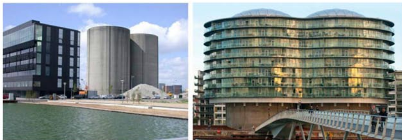
Рис. 2. Реконструкция силосов под жилье – Gemini. Копенгаген, Дания

Следующий проект схож с предыдущими двумя в силу конфигурации своего объема. Это наиболее масштабный из подобных ему проектов – реконструкция газометров в Вене (рис. 3). Изначально газометры представляли собой четыре цилиндрических телескопических газовых резервуара, объем каждого из которых равен примерно 90,000 \text{ м}^3 . Каждый из газометров имеет высоту 70 м и диаметр 60 м – параметры, достаточные для размещения в границах своего плана не только внутренних коммуникаций, но и объемов самих квартир. На сегодняшний день в комплексе функционируют концертный зал, вмещающий 2000-3000 человек, кинотеатр, муниципальный архив, студенческое общежитие, школа и детский сад. Жилой фонд комплекса составляет около 800 квартир, две трети из которых располагаются внутри стен газометров с 1600 постоянных жильцов, а также 70 студенческих комнат вмещающих около 250 студентов.