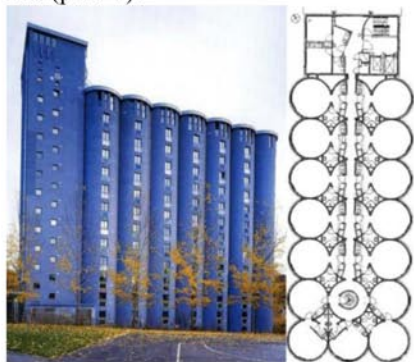
Рис. 1. Реконструкция элеватора под студенческое общежитие. Осло, Норвегия

Проект реконструкции элеватора в Осло – низкобюджетный проект 2001 года поразмещению в бывшем элеваторе 226 квартир для студентов (рис. 1).