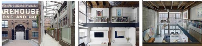
Рис. 4. Жилой комплекс Torpedohallen. Копенгаген, Дания

Интересен с точки зрения кардинального изменения структуры здания жилой комплекс Torpedohallen в Копенгагене (рис. 4).