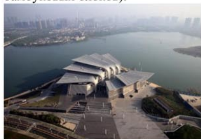
Рис.3. Большой театр в Уси, Китай, 2011 г., арх. студия PES-Architects

В интерьере и в экстерьере доминируют такие материалы, как алюминий и сталь, что не мешает образу здания оставаться свежим и естественным. (рис.4) При облицовке зрительного зала использовался традиционный китайский материал – бамбук (всего - 15 тыс. сплошных бамбуковых блоков).