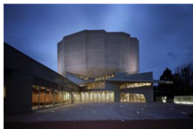
Рис.6. Культурный центр Кадар, 2011 г., г.Акита, Япония, арх. студия Чияки Араи

Пространство фойе выполнено в образе бетонной пещеры. Во внутреннем пространстве посетитель не чувствует замкнутости помещения, создается впечатление нахождения на открытом пространстве. (рис.7).