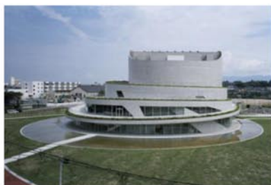
Рис.7. Akiha Ward Cultural Center, 2013 г., Япония, арх. студия Chiaki Arai Urban and Architecture Design

Выводы. Подводя итоги, следует отметить, что в современном мире, когда создано бесчисленное количество новых материалов, приемов строительства, конструкций; когда глобализация разрушает четкие границы между культурами разных народов в любой точке мира – современные архитекторы Востока сполна воздают дань своей культуре и зодчим прошлых тысячелетий, не копируя неактуальные для большого города образы, но создавая собственное, уникальное видение, имеющее под собой базу знаний в области современной мировой архитектуры и эстетику выразительности, унаследованную через века.