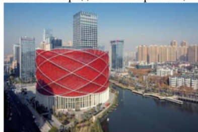
Рис.5. Театр Хан Шоу, провинция Хубэй, Китай, 2014 г., арх. студия Stufish Entertainment Architects

Построен архитектурной студией Stufish Entertainment Architects в 2014 г. в городе Ухань провинции Хубэй. (рис.5)