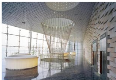
Рис.4. Большой театр в Уси, интерьер