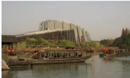
Рис.2. Театр Фуджень, 2010 г.

Большой театр в Уси. Был запроектирован и построен архитектурной студией PES-Architects в 2011 г. на искусственном полуострове вблизи города Уси. (рис.3).