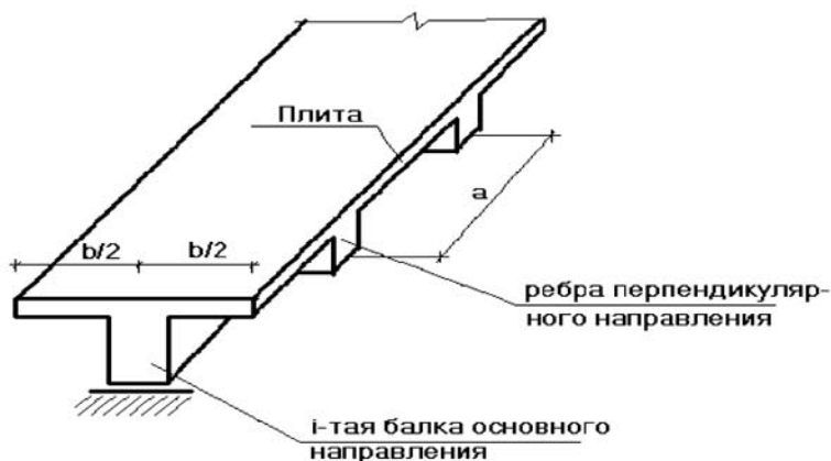
Рис. 3. Схема выделенного i -того ребра одного из направлений кессонного перекрытия при расчете численно-аналитическим методом

Без применения МКЭ расчет кессонного перекрытия можно производить с помощью предложенного в [3] общего метода расчета. При этом кессонное перекрытие рассекается продольными плоскостями, параллельными балкам одного направления. В результате такого рассечения получаются балки с полками, роль которых играют плита и балки перпендикулярного направления (рис. 3).