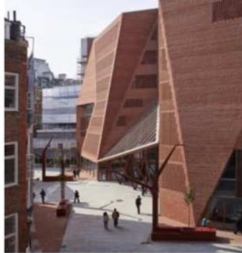
Рис.3. Проект студенческого центра Лондонской школы экономики