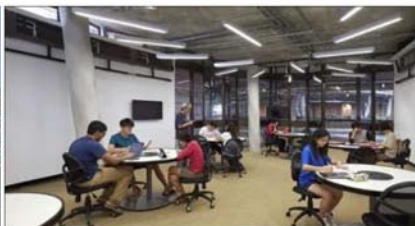
Рис.4. Обучающий Хаб (Learning Hub) в Наньянском технологическом университете (NTU Сингапур). Общий вид. Коворкинг пространство

Обучающий Хаб (Learning Hub) в Наньянском технологическом университете (NTU Сингапур), разработанный Heatherwick Studio в содружестве с ведущим архитектором CPG Consultants, является новой образовательной вехой в Сингапуре. В рамках плана реконструкции NTU кампуса, хаб предназначен для нового многофункционального здания, в котором будет обучаться часть из всех 33 000 обучающихся студентов [2].