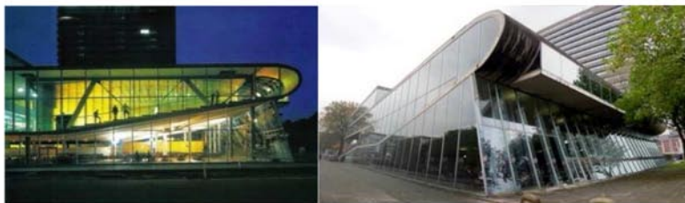
Рис.2. Студенческий центр «Эдукаториум» (Голландия)

Мастерская «О'Доннел & Туми» выиграла конкурс на проект студенческого центра Лондонской школы экономики . Здание войдет в состав кампуса школы, расположенного в Олдуиче (район Вестминстер): этот комплекс ничем не отделен от окружающей застройки и является естественным ее продолжением. В новой постройке будет расположены приемная студенческого союза, кафе, пространства для проведения различных мероприятий, медиа-центр и офисы (рис.3) [4].