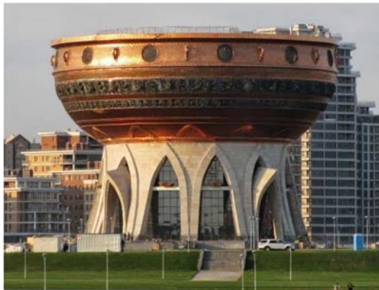
Рис. 3. Центр семьи «Казань» в Казани, Россия

Самый большой из них - Золотой (до 35 человек), меньше всех – Восточный (до 25 человек). Восточный зал великолепен своими орнаментами, Золотой и Серебряный отличаются друг от друга цветом мраморной плитки. Наибольшей популярностью пользуется Золотой зал.