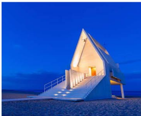
Рис. 1. Главный фасад Прибрежной Часовни (Seashore Chapel), Бэйдайхэ (Китай)

скрывает людей от палящего солнца и служит местом для отдыха. На втором уровне — классический скромный интерьер часовни со множеством скамей. Все оконные переплеты, кроме алтарного панорамного остекления, скрыты в складках стен, что делает фоновый свет рассеянным и загадочным. [1]