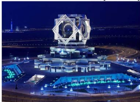
Рис. 5. Дворец бракосочетания «Багт кошги» в Ашхабаде.

Дворец бракосочетания, построенный в Ашхабаде турецкой строительной компанией «Полимекс» по заказу Правительства Туркменистана.