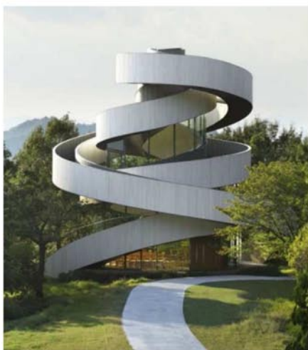
Рис. 2. Главный фасад Часовни-Ленты (Ribbon Chapel), Ономичи, Хиросима

Часовня невелика. В состав помещений входит небольшой уютный зал, который вмещает всего 80 приглашенных гостей, комната жениха и комната невесты. Стены здания, не считая лестниц остеклены, что позволяет насладиться панорамой острова с вершины холма. [3]