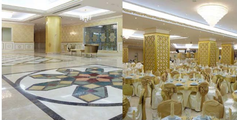
Рис. 6. Интерьеры холла и банкетного зала в «Багт кошги», Ашхабад.

Выводы: В строительстве дворцов бракосочетания используются разнообразные конструктивные и декоративные решения, которые зависят не только от планировки и функциональных характеристик, но также глубоко пропитаны символическим смыслом, что крайне важно для подобных сооружений. В проектировании Дворцов бракосочетания нет строгих норм и рамок, что позволяет создавать поистине потрясающие воображение шедевры. Тема подлежит дальнейшему исследованию и интересна в разработке дипломного проекта.