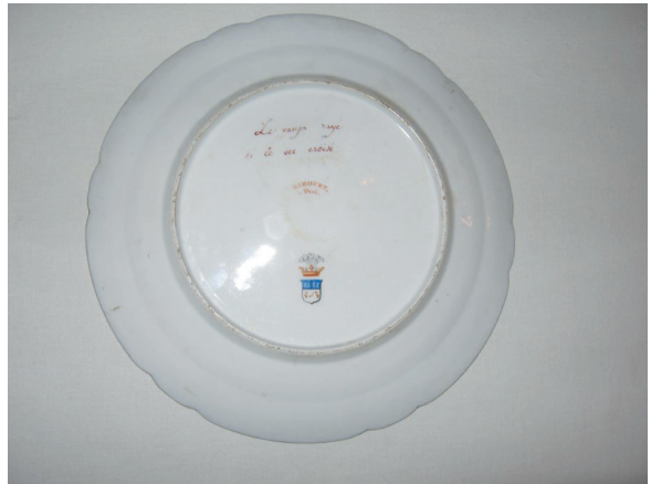
Рис. 4. Обратная сторона тарелки с изображениями экзотических птиц.