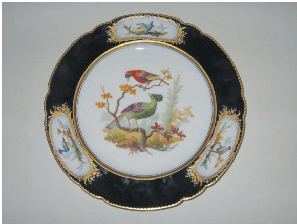
Рис. 3. Декоративная тарелка с изображениями экзотических птиц, XIX в. Фарфор. Роспись надглазурная, золочение. Rihouet, Париж. Частная коллекция. Фото автора статьи