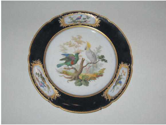
Рис. 1. Декоративная тарелка с изображением попугаев. XIX в. Фарфор. Роспись надглазурная, золочение. Rihouet, Париж. Частная коллекция.