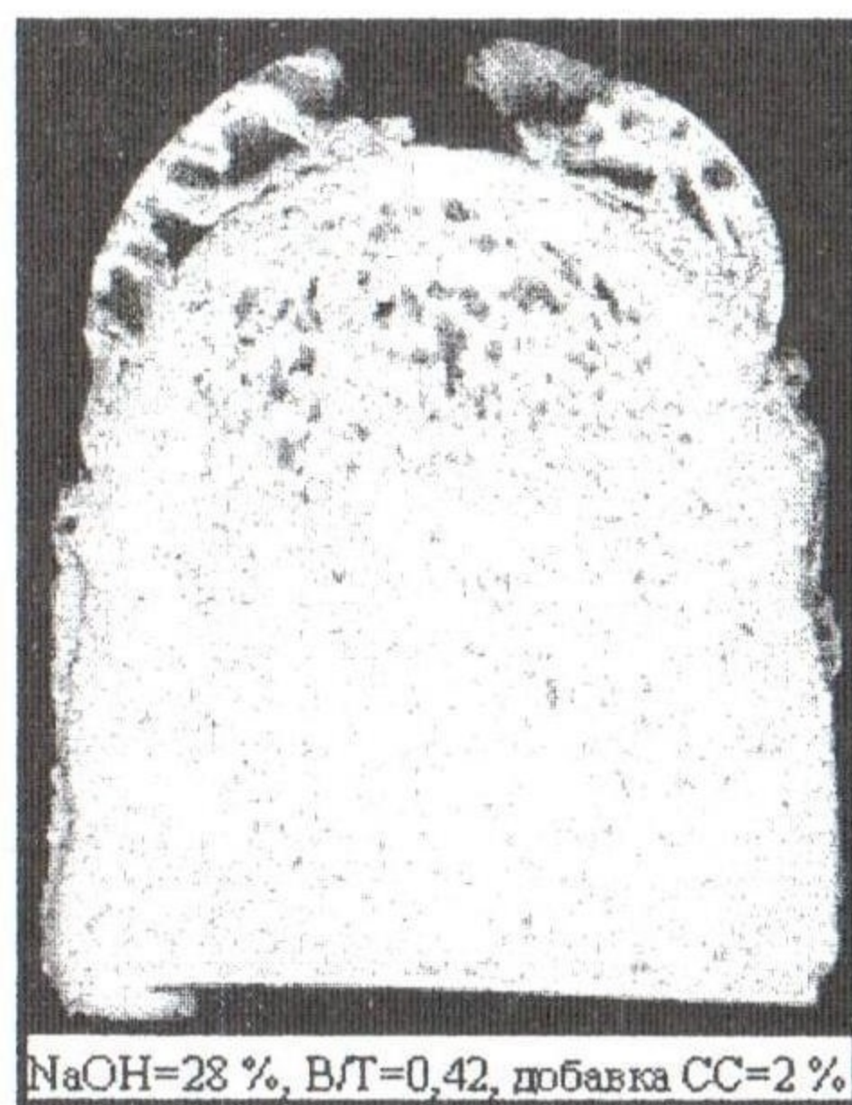
NaOH=28 %, В/Г=0,42, добавка СС=2 %

Использования специфических свойств железного сурика как добавки-плавня в комплексе с другими добавками (глиной, ракушкой и