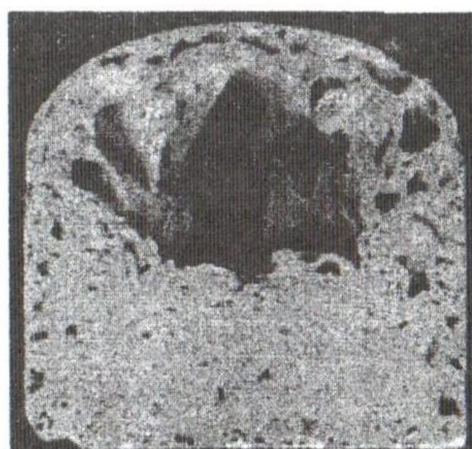
Рис. 3. Характер пористости кремнепора с добавкой свинцового сурика 2 %