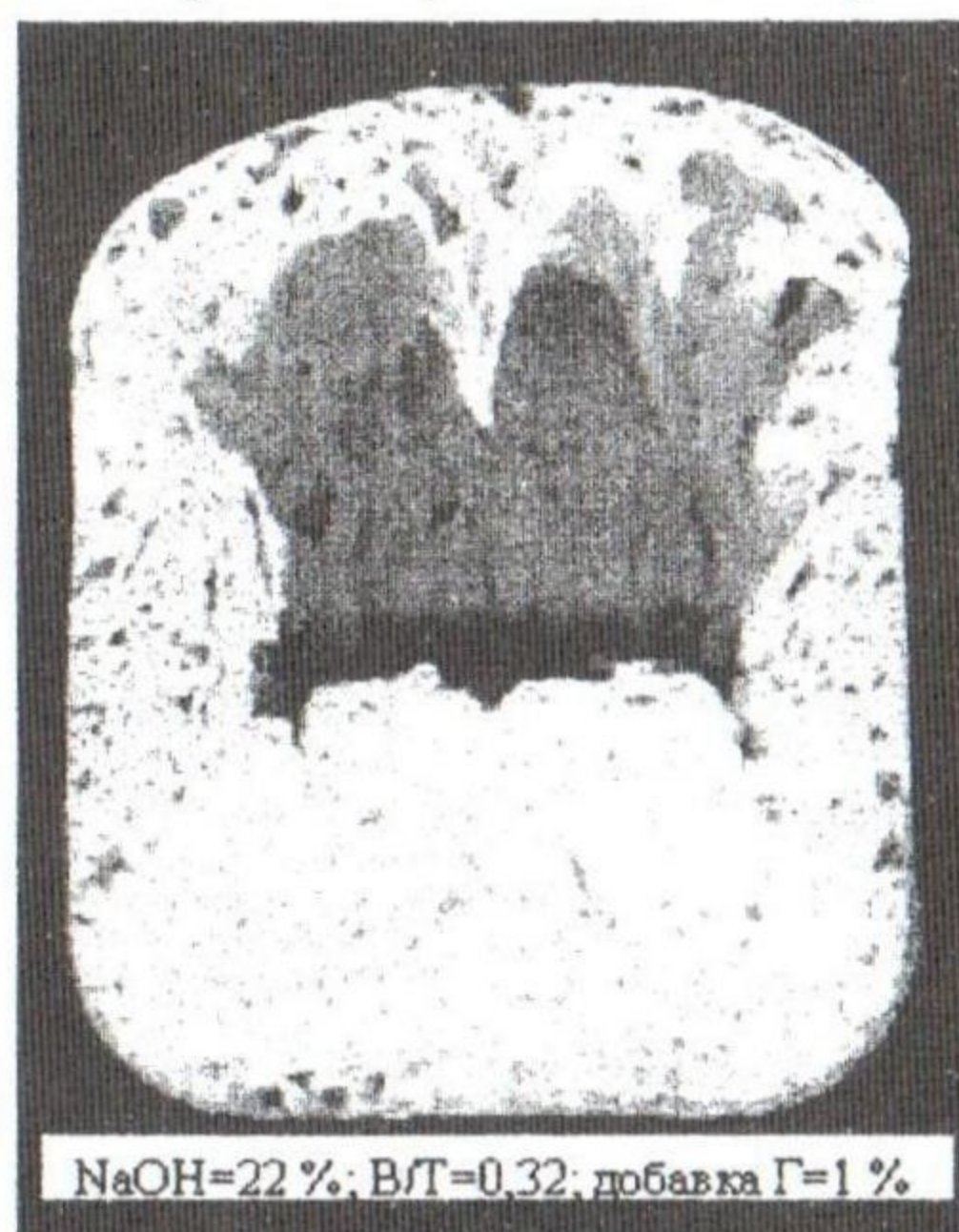
Рис. 2. Характер пористости кремнепора с содержанием глины 1%

Характер пористости кремнепора с добавкой глины зависит от её содержания. При содержании глины от 0 до 3 % (Рис. 2) в верхней части образца наблюдаются макропустоты, которые с повышением содержания добавки уменьшаются в своём объёме. Образование макропустот в верхней части образца свидетельствует о том, что процессы вспучивания и твердения десинхронизированы, причём вспучивания кремнепора значительно опережает процесс твердения.