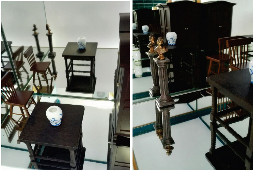
Fig.2. A stand for demonstration of reflection in interior

application such method at the study of other themes of a descriptive geometry (Sydorova, 2017).