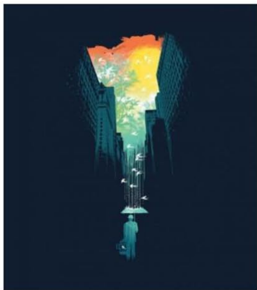
Рис. 1. Образность, которая не разработана на фасадах, не способна исчезнуть, как таковая, – мы предпочитаем её наблюдать. Цель – увидеть образ человека, видоизменённый, стилизованный. И, если «линия горизонта» – контур верхней границы небоскрёба, как мы видим на графическом изображении сингапурского иллюстратора и дизайнера Буди Сатриа Квана, образ человека расположен выше – над ней.

Построить феноменальную схему, В которой бы преобразился дом. И национальность, и математичность Со стилем едва пересечены, А нам пропустить бы их сквозь поэтичность, Посмотрим, на что они обречены.