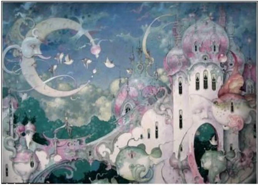
3.2. Деформация «плавления»