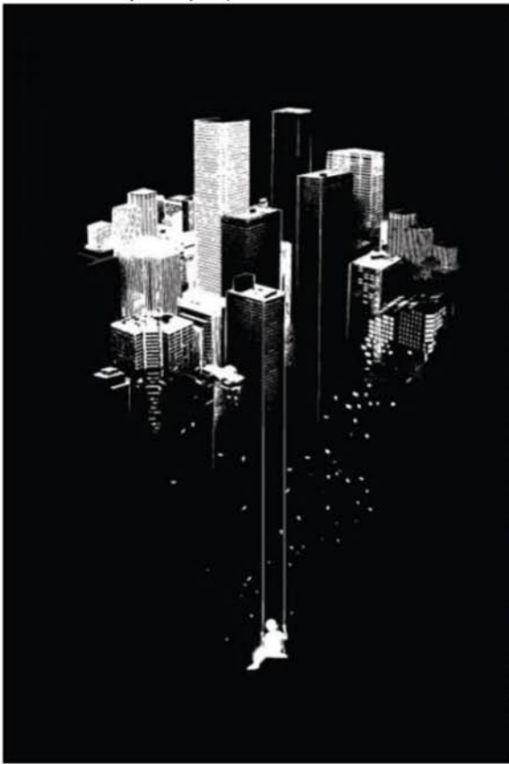
3.3. Взлёт «уединения»