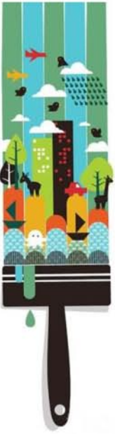
3.1. Скрежет «воспарения» (небоскрёб – с англ. skyscraper)