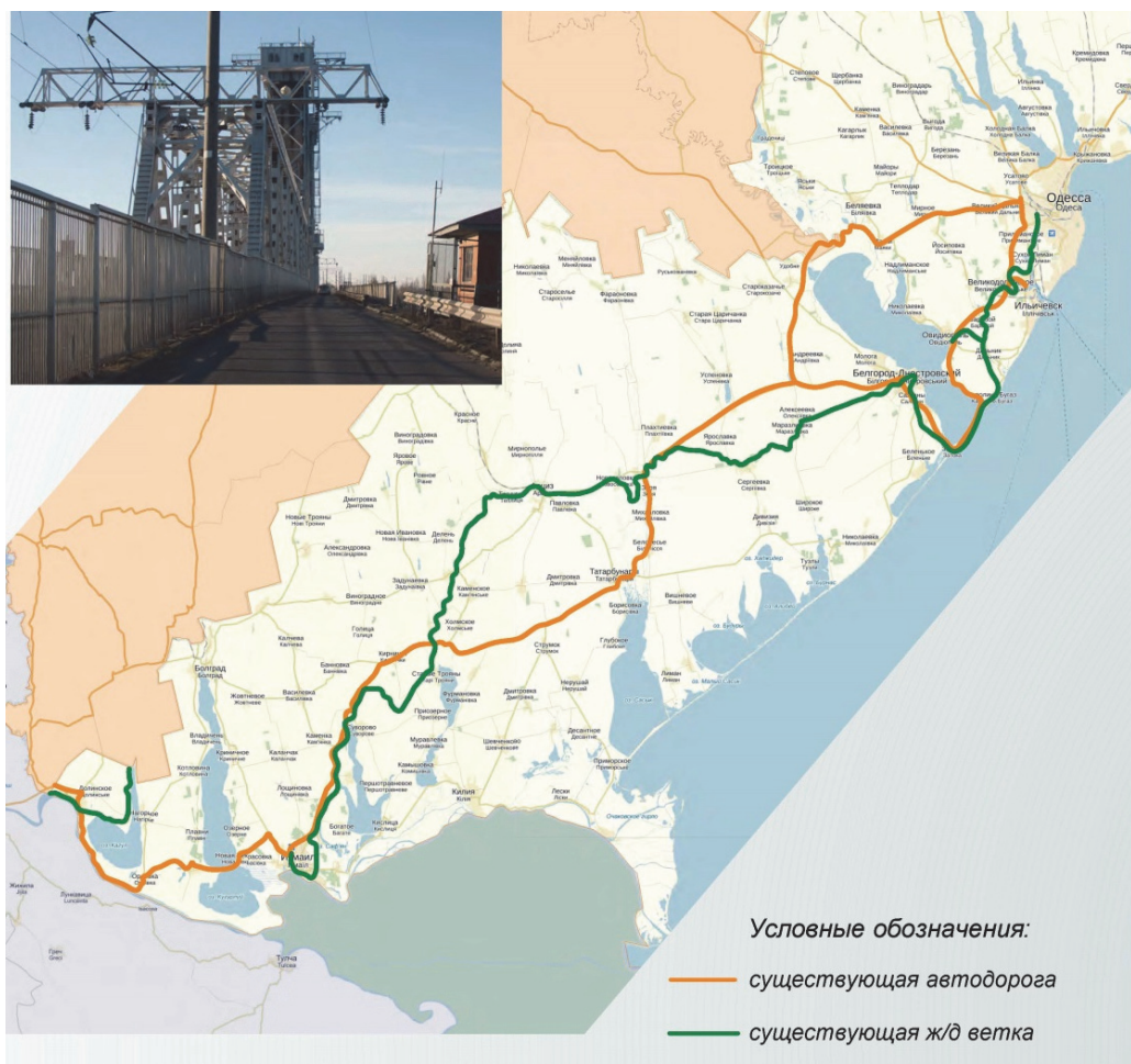
Схема ж/д Одесса-Измаил и автодороги Одесса-Рени

Существующие проекты моста рассчитаны только на автомобильное движение и пересекают акваторию южнее Белгород-Днестровского порта. Необходимость обеспечить судоходство в этих проектах многократно увеличивает инвестиционные издержки. Высота пролета от уровня воды должна быть не менее 36 метров и длина более 150. Стоимость 1 км подобного моста в мировой практике от $100 млн. Уклоны моста в этих вариантах не позволят проложить железную дорогу. Озвученная стоимость проектов от 500 млн.