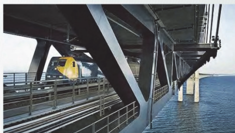
Прототип: Эресуннский мост (Дания-Швеция) — совмещенный мост, включающий 2-х путную железную дорогу и 4-х полосную автомагистраль

Совмещенный мост, связывающий Белгород-Днестровский и Овидиополь сократит на 36 км расстояние до Одессы и позволит полноправно включить Белгород-Днестровский в Одесскую агломерацию и программу доступности городской электрички в течение 1 часа.