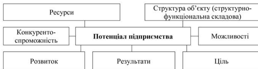
Рис. 2. Підходи до визначення сутності потенціалу підприємства