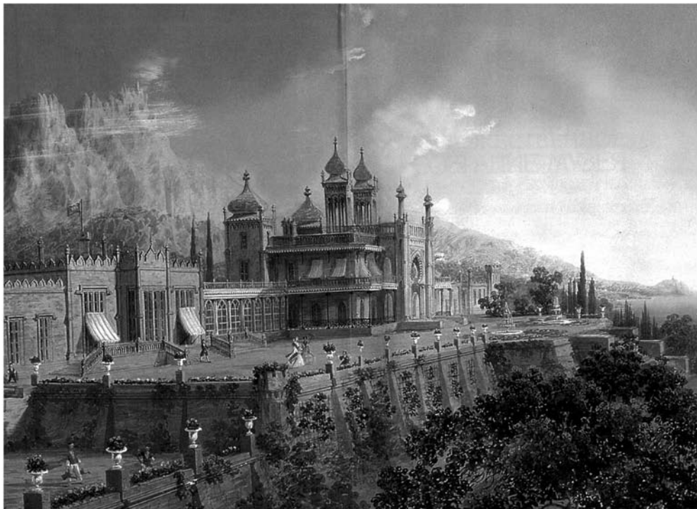
Рис. 4. Боссоли К. Дворец князя Воронцова. Гуашь. Ок. 1842 г. Частное собрание. Великобритания [18, форзац]