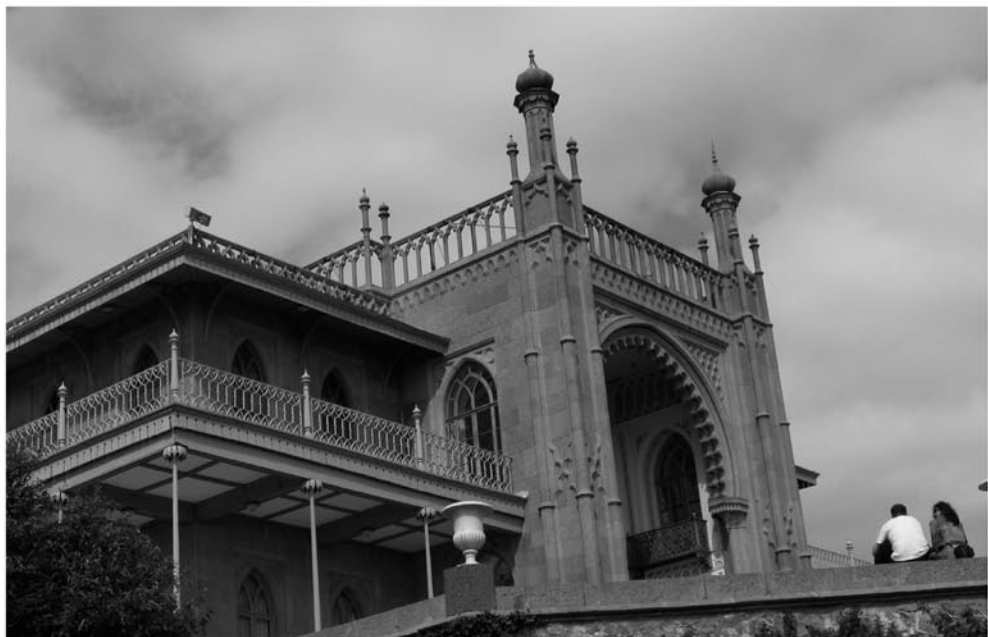
Рис. 1. Центральный корпус Алушкинского дворца М. С. Воронцова. Вид с юго-запада. Сентябрь 2008