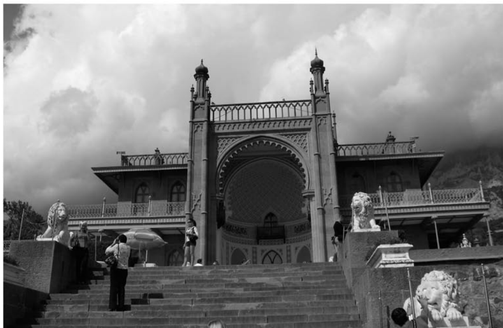
Рис. 2. Центральный корпус Алушкинского дворца М. С. Воронцова. Сентябрь 2008