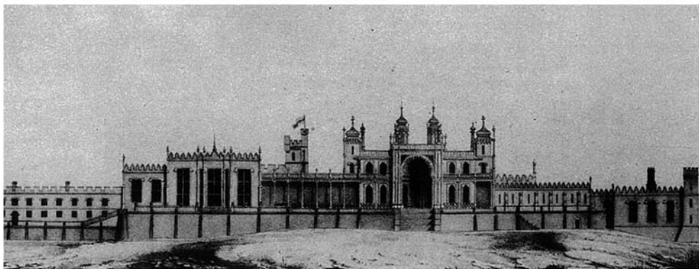
Рис. 5. Гунт В. Южный фасад Алушкинского дворца М. С. Воронцова. Литография. 1851 г. [2, с. 20]