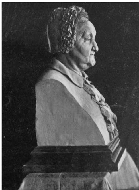
Илл. 3. Б. В. Эдуардс. Портрет К. Х. Рубинштейн

внешностью, а его твердый характер и стойкие академические убеждения вошли в легенду. Южанин с крупными, но правильными чертами лица. Человек, для которого идеалы классического искусства являлись святыней.