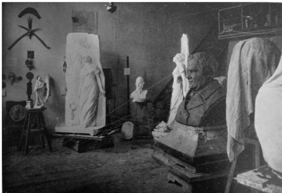
Илл. 5. Мастерская Б. В. Эдуардса

звать его гипотетичным, однако гипотезы, если они подтвердятся, могут многое добавить к творческой биографии Б. В. Эдуардса и его роли в художественной жизни Одессы.