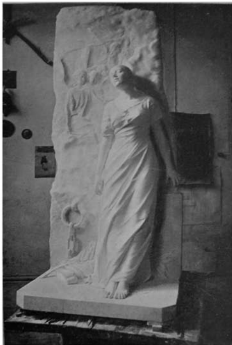
Илл. 1. Б. Эдуардс. «Слава в вышних Богу...» («Христианка»)