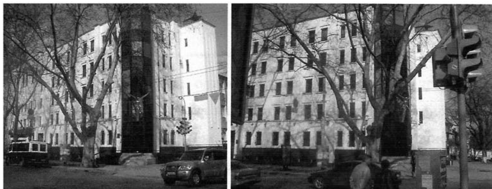
Рис. 3. Центр реабилитации детей-инвалидов «Будущее», г. Одесса

Одесский Центр реабилитации детей-инвалидов «Будущее» (рис. 3) создан в 1996 году. Его вместимость 150 человек. Он является негосударственной некоммерческой организацией, руководство которой осуществляет благотворительный фонд «Будущее». Комплексный подход к ребенку с ограниченными возможностями здоровья, который реализован в Центре, содействует решению наиболее актуальных задач медико-социальной реабилитации и улучшению качества жизни детей-инвалидов и детей с ограниченными возможностями здоровья. Все виды помощи в Центре предоставляются бесплатно. Здание построено для данного центра с учетом большинства санитарно-гигиенических требований, запрограммированной развитой функцией (консультации, лечение, обучение, социальная реабилитация), а также построены гостиница для проживания детей и родителей и учебный компьютерный центр.