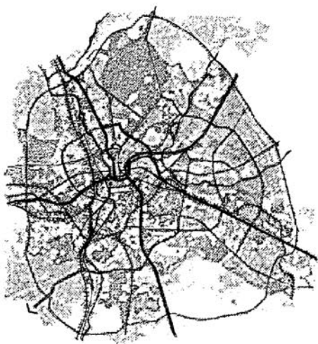
Генеральный план Харькова 2003 г.