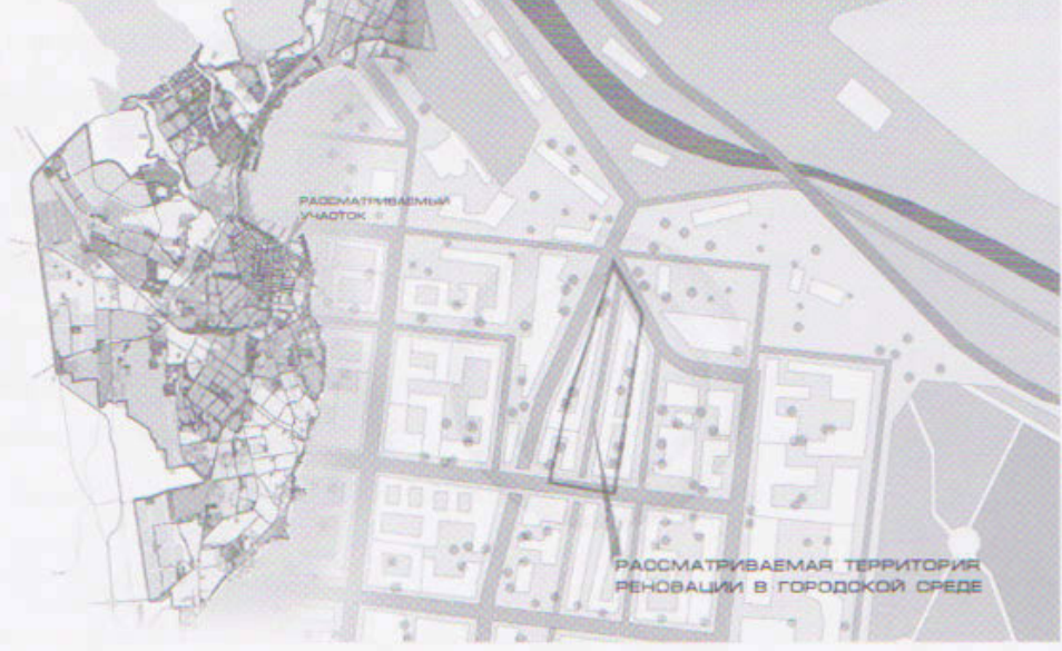
Рассматриваемая территория реновации в городской среде