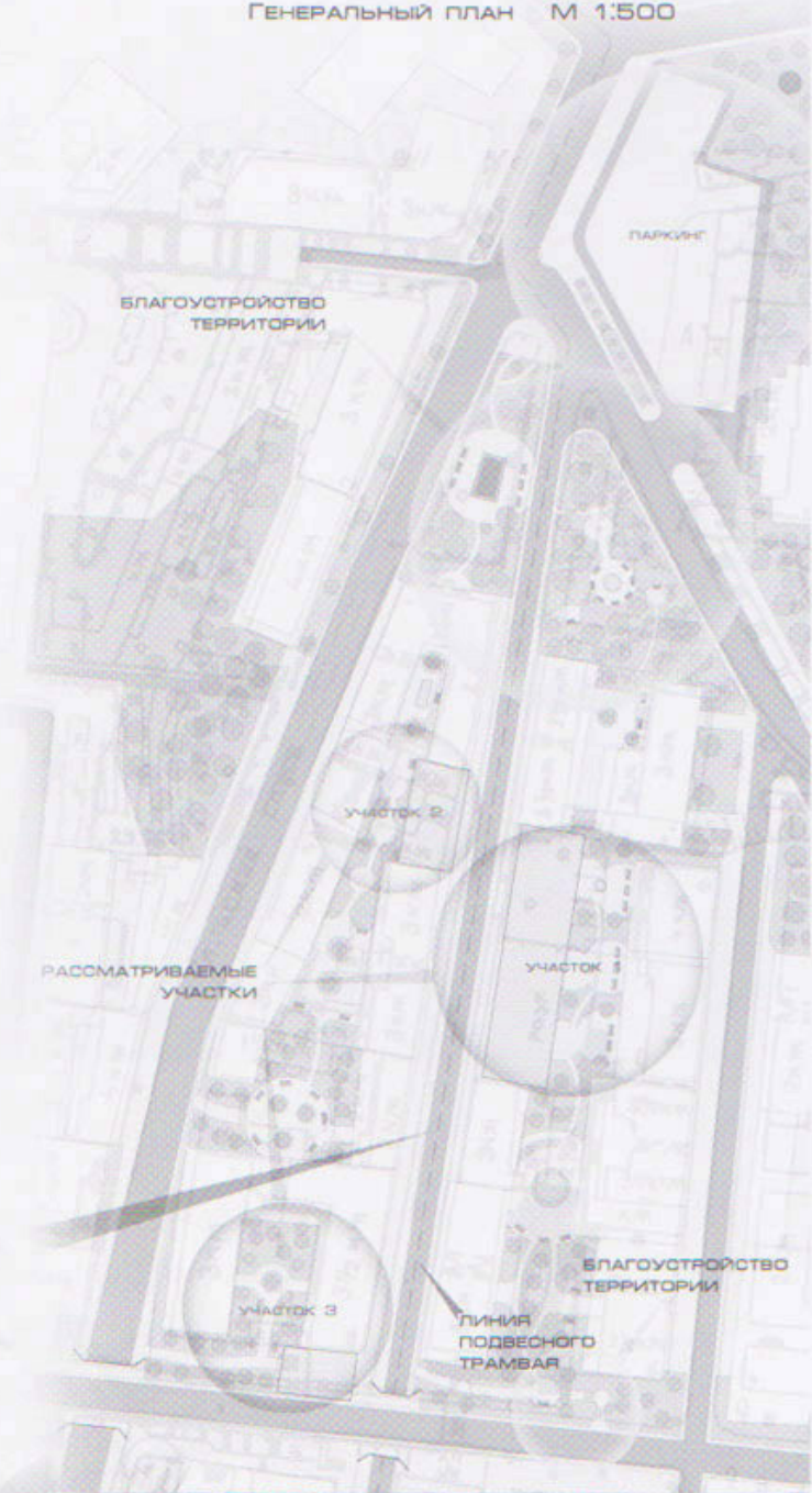
Обозначение территории в масштабах города

Предлагаются следующие проектные решения жилых домов: капитальный ремонт существующих домов, строительство новых объектов инфраструктуры, создание пешеходных зон и организацию общественного транспорта.