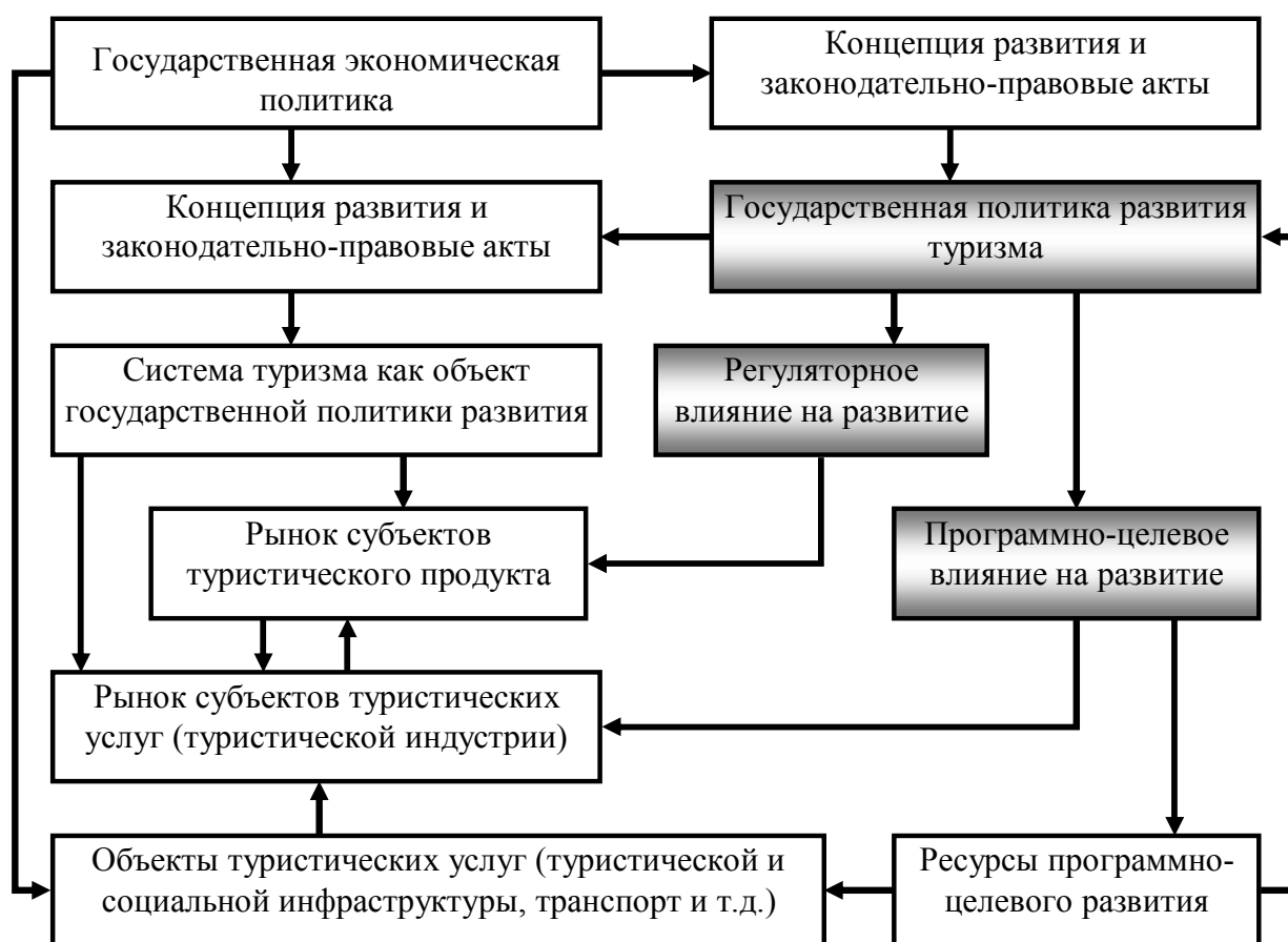
Рисунок 2. Декомпозиция организационной структуры государственной политики развития туризма на регуляторное и программно-целевое влияние (разработка авторов).

Таким образом, в основе системного подхода в сфере государственной политики развития туризма, находится рассмотрение любого явления и экономического процесса как сложной системы, которая, с одной стороны, имеет свою структуру с многообразием внутренних связей, а с другой стороны является составной частью более сложной системы. Вследствие этого необходимо рассматривать не только внутренние связи