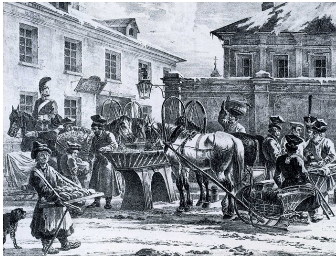
Илл. 1 Почтовая станция, XIX в.

Стремление к знаниям и деловая хватка позволили Джован Пьетро Вьёсе предпринять крупные передвижения по Центральной и Восточной Европе, Турции и Тунису (илл. 2). Имя этого человека тесно связано с европейской культурой, с открытием для Италии новых горизонтов для развития важных ресурсов обмена - культура, информация, товары, люди. Оставленные им путевые заметки, свидетельства о прошлом, помогают максимально погрузиться в культурный контекст того времени □.