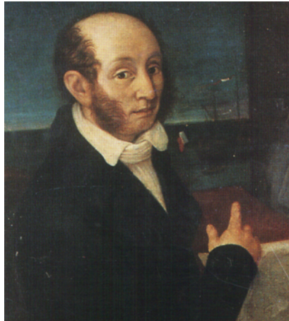
Илл. 3 Джован Пьетро Vieusseux

Джован Пьетро Вьёсё родился 28 сентября 1779 года в купеческой семье швейцарского происхождения в Oneglia, недалеко от Imperia (илл. 3). Его отец, адвокат, был вынужден покинуть страну по политическим причинам, и переехал в Лигурию, где семья с 1763 года управляла бизнесом.