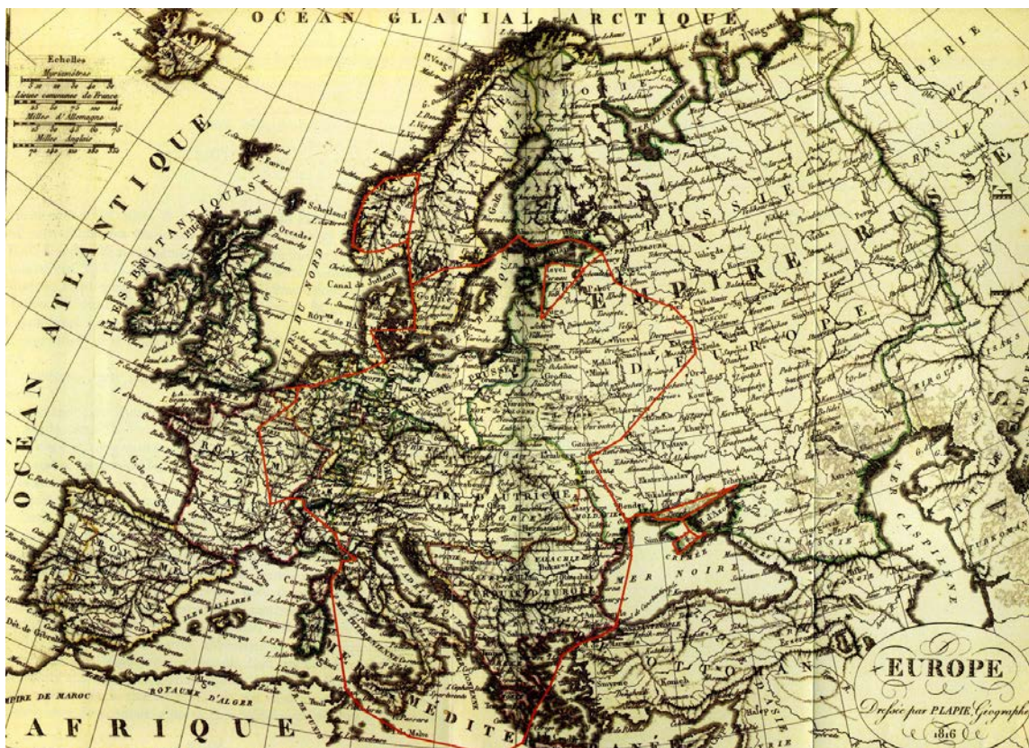
Илл. 2 Почтовая станция, XIX в.

Стремление к знаниям и деловая хватка позволили Джован Пьетро Вьёсе предпринять крупные передвижения по Центральной и Восточной Европе, Турции и Тунису (илл. 2). Имя этого человека тесно связано с европейской культурой, с открытием для Италии новых горизонтов для развития важных ресурсов обмена - культура, информация, товары, люди. Оставленные им путевые заметки, свидетельства о прошлом, помогают максимально погрузиться в культурный контекст того времени □.