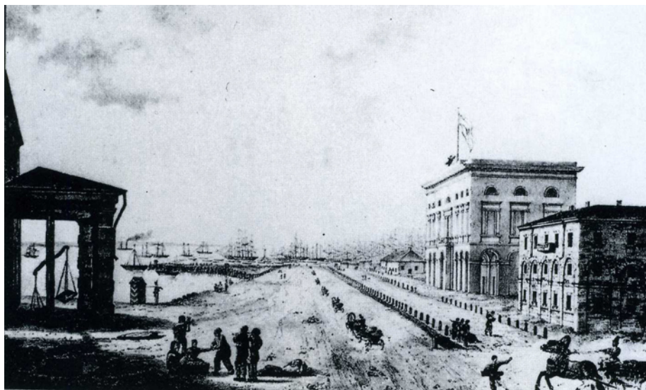
Илл. 5 Вид на Карантин порта Одессы

Информация о становлении «процветающего морского порта и самого удивительного места в империи», о врожденном космополитизме города широко представлена в работах целого ряда авторов - М. Гутри, А.Марсель, Ш. Сикар, М. Холдернесс, Р. Лайялл, Г. Кастельно, Ж. Ф.Гамба и др. В изданном дневнике Д.П. Вьёсё опубликовано редкое изображение Карантина порта Одессы (илл. 5).