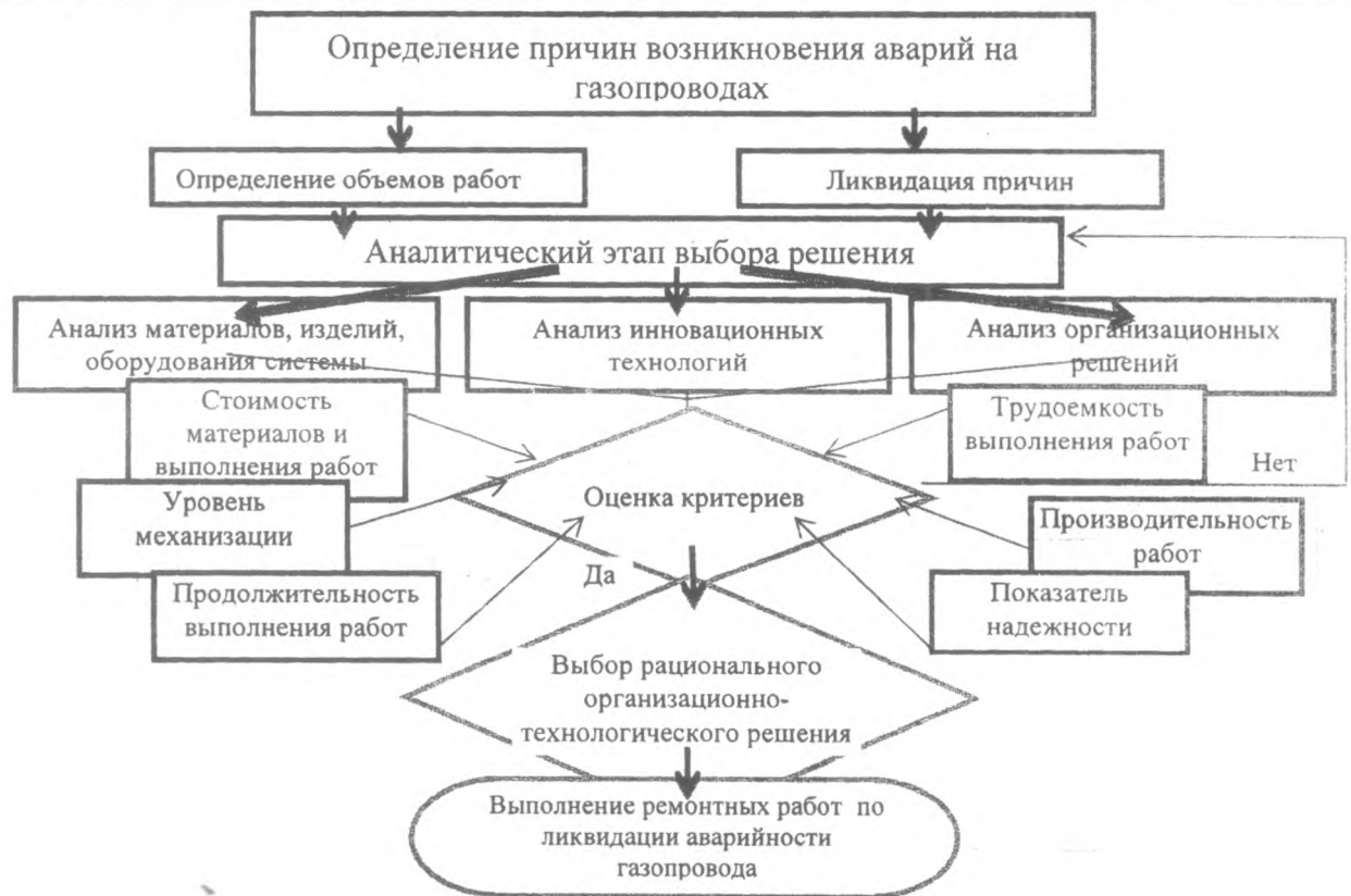
Рисунок 2 – Блок-схема выбора рационального организационно-технологического решения ремонта или замены участка газопровода

Первый этап заключается в анализе основных причин возникновения аварий на газопроводах, который приведен в таблице 1.