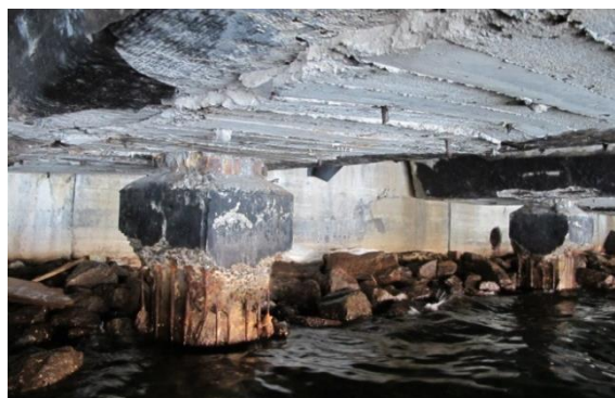
Рис. 4. Состояние нижней поверхности плиты ростверка и наголовников свай