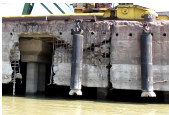
Рис. 2. Состояние бортовой балки