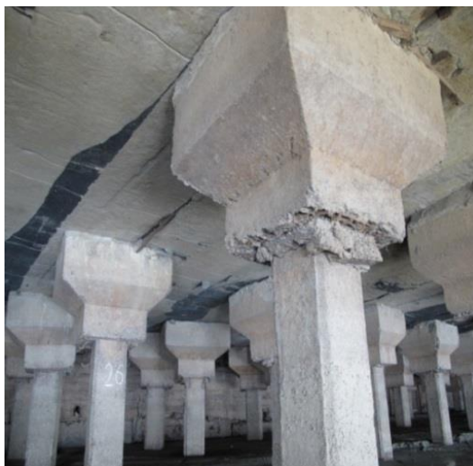
Рис. 1. Состояние сваи и наголовника