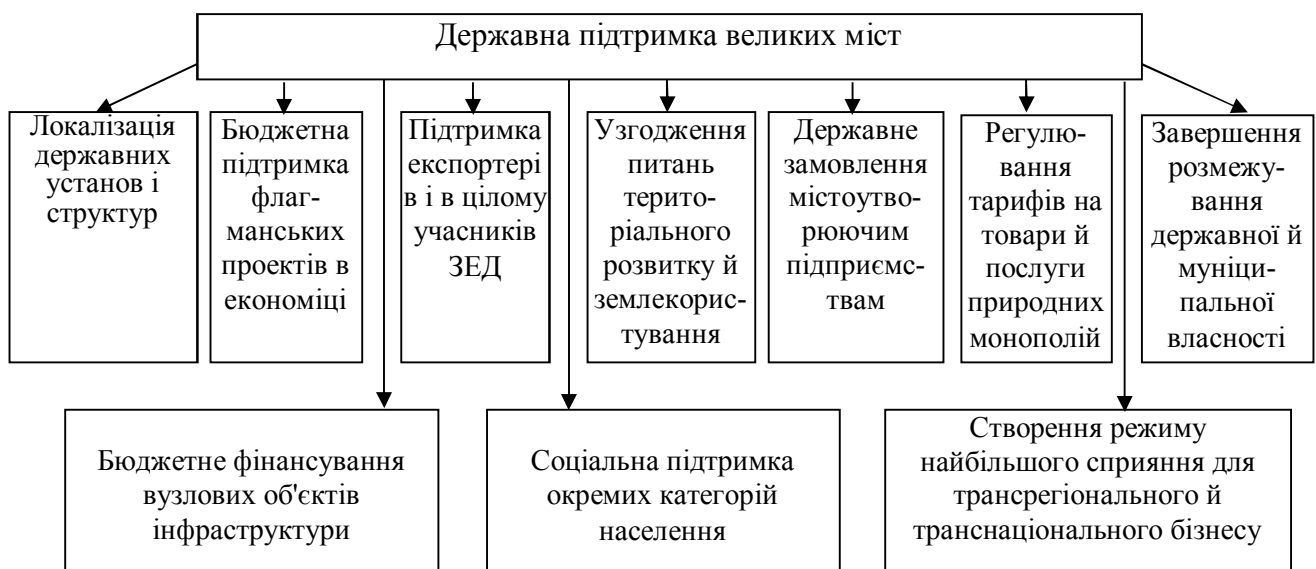
Рис. 2 Основні напрямки державної підтримки розвитку великих міст із урахуванням фактору глобалізації

У цьому зв'язку необхідно виділити базові пріоритети (нарощування сучасних функцій і загальної експортоорієнтованості міської економіки; випереджальний розвиток інфраструктури бізнесу й міжнародного туризму; перехід від конкуренції великих міст до їх мережних взаємодій; нейтралізація негативних екстерналій глобалізації й ін.) і напрямки державної підтримки розвитку великих міст із урахуванням фактору глобалізації (рис. 2).