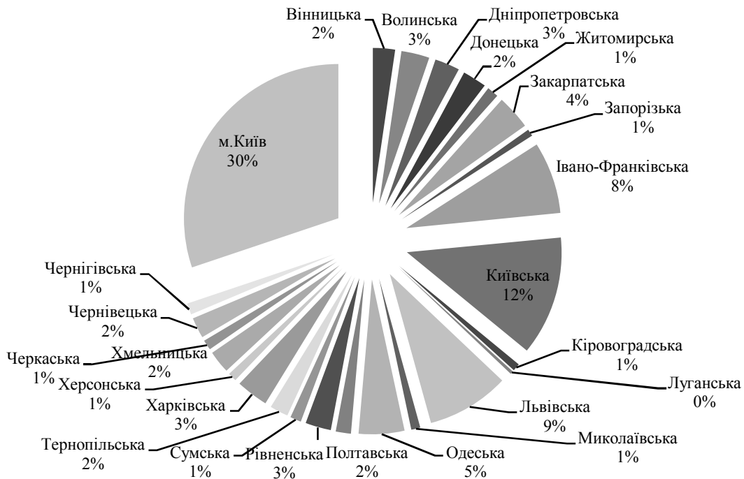
Рис. 2. Розподіл інвестицій в будівництво за регіонами [6]

будівельному комплексі, в основному, мають сезонний характер, можна прогнозувати, що різниця в 21531,3 млн. грн. навряд чи суттєво зміниться за останній період.