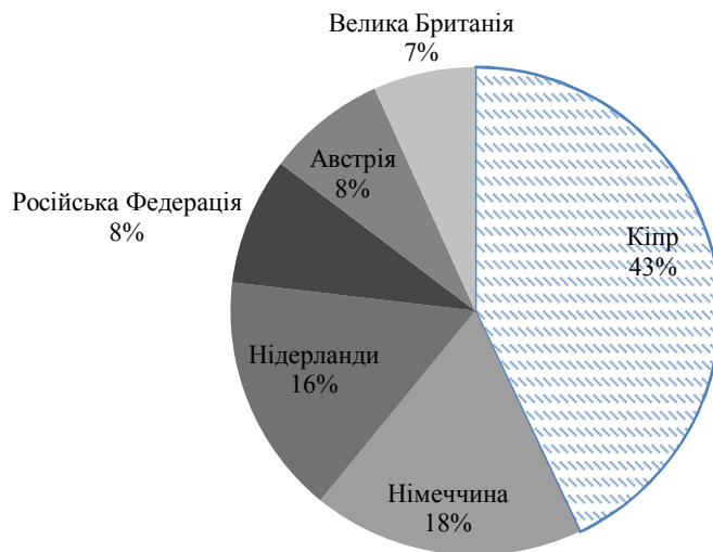
Рис. 3. Структура іноземних капітальних вкладень [7]

Найбільшу активність виявлено в м. Київ – в 2014 році виконано 21,59% від загального обсягу, в 2015 році за період з січня по серпень – 22,85%. В грошових одиницях обсяги виконаних будівельних робіт значно скоротилися. Так, в 2014 році їх сума склала 11034,3 млн. грн., а за період з січня по серпень 2015 року – 6759,8 млн. грн. Значна частка припадає на будівництво інженерних споруд – 51,36%, зведення будівель