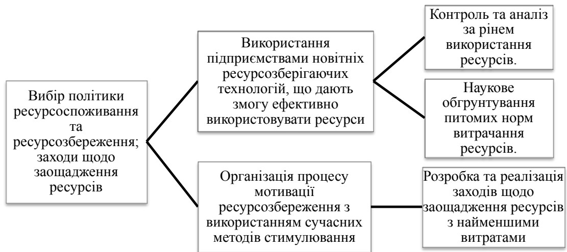
Рис. 4. Стратегія ресурсозбереження на підприємстві