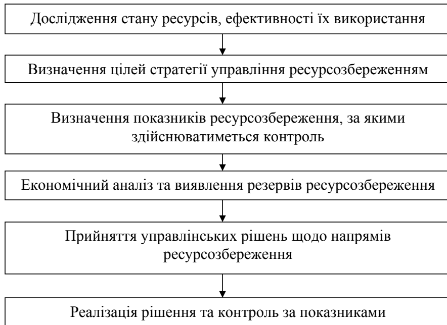
Рис. 3. Прийняття управлінських рішень щодо ресурсозбереження

Сукупність організаційних, техніко-технологічних, корегувальних та контрольних захо-