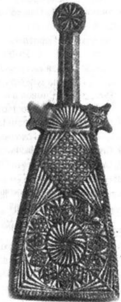
Дощечка для прання. XIX ст. Дерево.