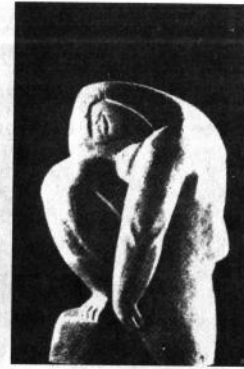
О. Архипенко. Жінка. 1909. Камінь. 53, 3.

Батьківщина – це водночас і символ, і засіб узагальнення стосовно невидимого і могутнього світу пращурів і сил, які дали життя людям і природі. Україна – земля хліборобів, менталітет яких історично пов'язаний з природним циклом. Тому українцям генетично властивий оптимізм і впевненість у вічному відродженні. Життєрадісність, святковість характерні для народного мистецтва та ікони. Для художників модерну й авангарду вони стали підпорою у надбанні втраченої цілісності матеріального й духовного начала.