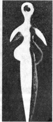
О. Архипенко. Та, яка літає. 1957.