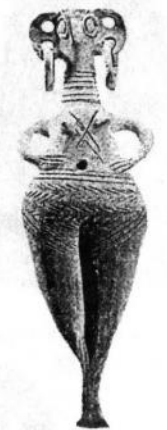
Статуетка богині з о. Кіпр. XV-XIII ст. до