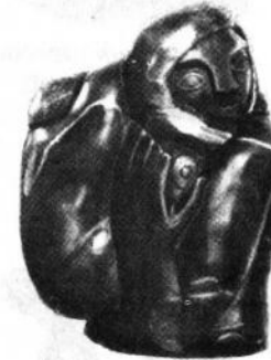
О. Архипенко. Мати і дитя. 1910. Чорний мармур. 38.