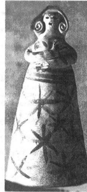
Лялька. XIX ст. Вороніж. Кераміка.