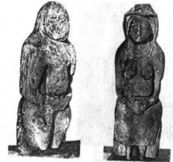
Кам'яні «баби». IX – XII ст. Камінь.