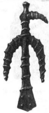
Птахоподібне зображення з Гори Азов. Пізній палеоліт.