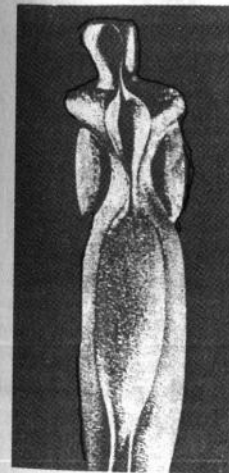
О. Архипенко. Вертикальний торс. 1957. Кераміка.