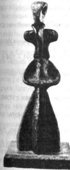
О. Архипенко. Статуя на алюмінієвому п'єдесталі. 1957 Поліхромна бронза. 46,3.