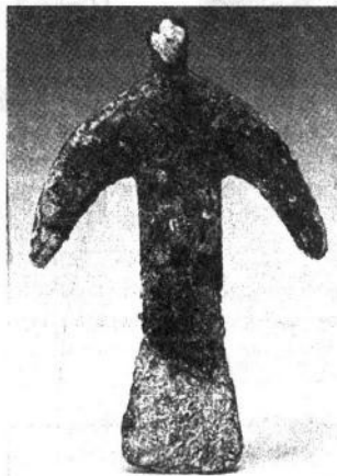
Фігура птаха зі стоянки Мезино. Кінець I тис. до н. е. Бронза.