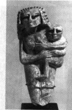
Статуетка жінки з дитиною. Середнє царство. Поч. II тис. до н. е. Вапняк. 15,3