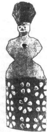
Лялька-панка. XIX ст. Архангельська губернія.