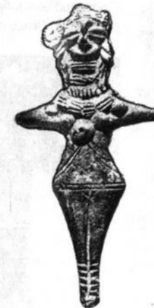
Богиня «Мати при-рода». Долина Інда. III тис. до н.е. Глина.