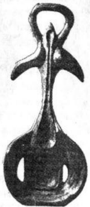
О. Архипенко. Статуетка. 1957. Бронза.