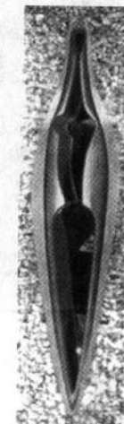
О. Архипенко. Океанічна мадонна. 1957. Дерево.