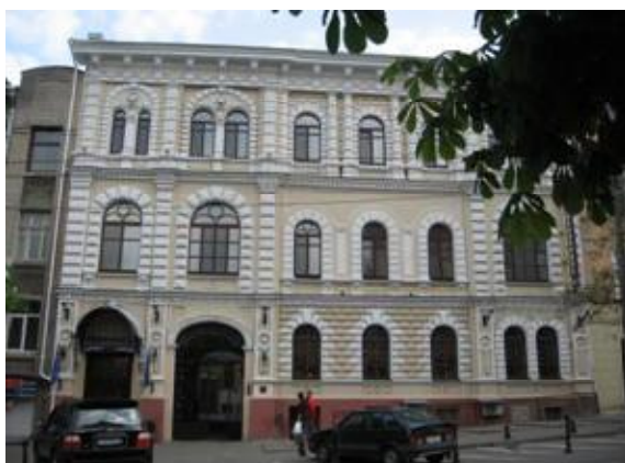
Рис.6. Дом Абрамсона., 1852г., арх. И.С.Козлов