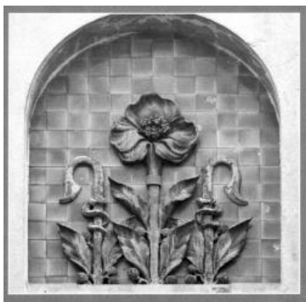
Рис. 3. Елемент рослинного орнаменту