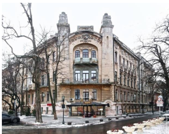
Рис. 5. Прибутковий дім Луцького