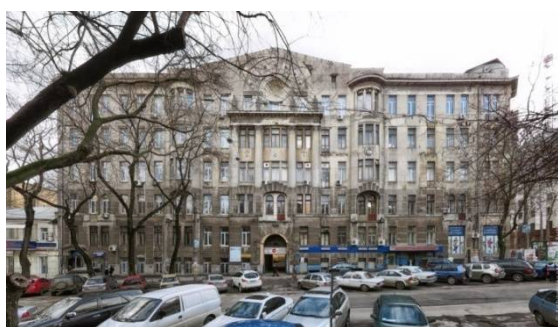
Рис. 8. Будинок Асвадунова

Знайомство з європейськими школами модерну виникло до життя кілька потужних напрямків, кожен з яких залишив великий слід в одеській архітектурі. Перш за все, це раціональний модерн, модернізований ренесанс, неоампір і неоготика.