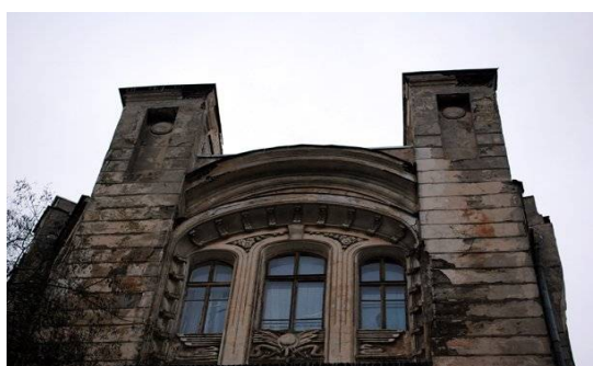
Рис. 7. Барельєф дому Вуфгардт