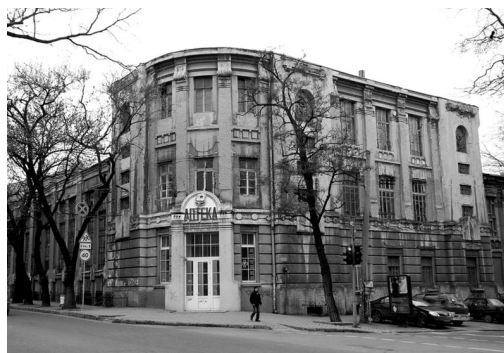
Рис. 2. Чаєфасовна фабрика на розі Троїцької і Канатної