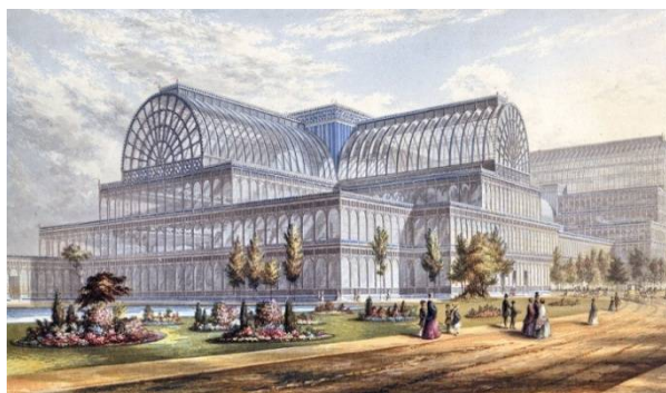
Рис. 1. Кришталевий палац до пожежі. Лондон, 1851

Після цього наступний етап у розвитку одеського модерну припав на 1909–1916 роки, коли він перетворився в стиль з безліччю підвидів. З авангардного стилю, послідовники якого прагнуть до незвичності, модерн став форматом житлової забудови середнього класу, що не передбачало акценту на художню цінність. Головні зміни відбуваються в цей час всередині будинку, а не зовні. Галерейна система розташування квартир тепер не використовується зовсім – на зміну їй прийшла вдосконалена секція. Сходові клітини зменшуються у розмірах, все частіше застосовуються гвинтові сходи. В елітних будинках встановлюються ліфти, наприклад, таких як будинок Асвадурова на розі Пушкінської (рис.8) і Троїцької та будинок Новікова – на розі Дерibasівської та Рішельєвської. Планування квартир поступово стає типовим, наближаючись до «ідеалу» того часу. Обов'язковою приналежністю стають лоджії, комори, ванна і туалет [5].