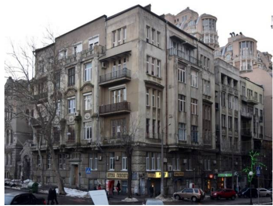
Рис. 10. Будинок Маргуліс