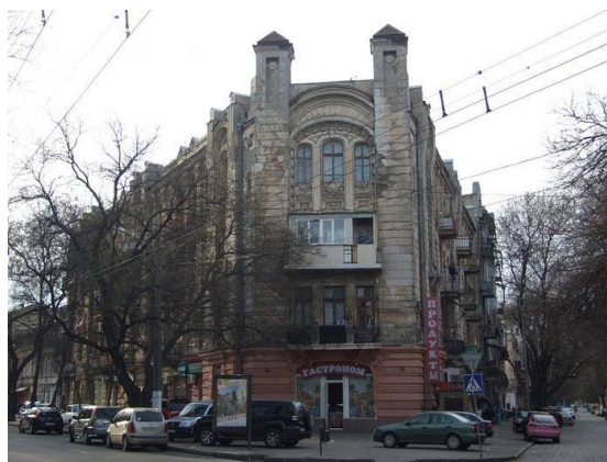
Рис. 6. Прибутковий дім Вуфгардт