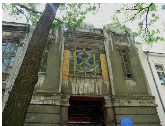
Рис. 4. Елемент мозаїчного панно