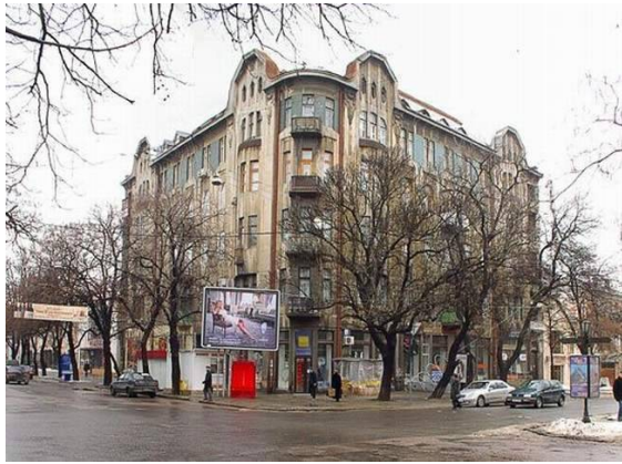
Рис. 9. Будинок на вулиці Єкатерининській, 35