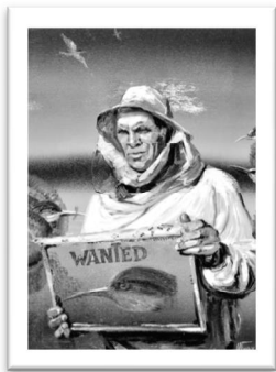
Рис. 2. Пархоменко М. «Пасічник» к., о., 100x80