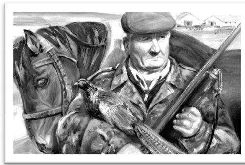
Рис. 4. Чепульська М. «Єгер» п. на картоні 68x86

Дана серія портретів, за ініціативою власника художнього музею О.А. Паларієва, що запросив художників, оспівує людей Бессарабії, міцно стоячих на землі і не втративших багатотисячових традицій ведення сільського господарства. Портрети знаходяться в музеї, в безпосередній близькості до робочих місць зображуваних героїв.