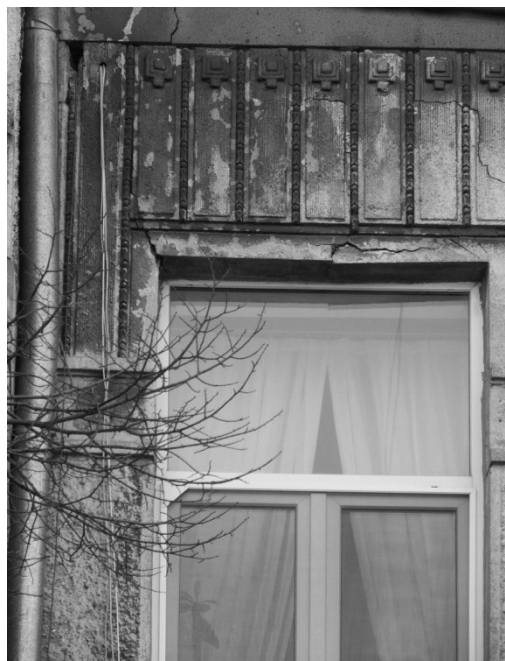
Рис. 2. Доходный дом Яворовских, 1911 г., арх. В. И.Кундерт, г. Одесса, ул. Нежинская, 64.