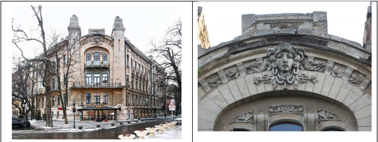
Рис. 9. Дом Луцкого, Маразлиевская ул., 2, 1902 г., арх. М. И. Линецкий

изображением аистов. Предположительно это изображение славянской богини Зари, в виде женского лика и в виде её символа-аиста.