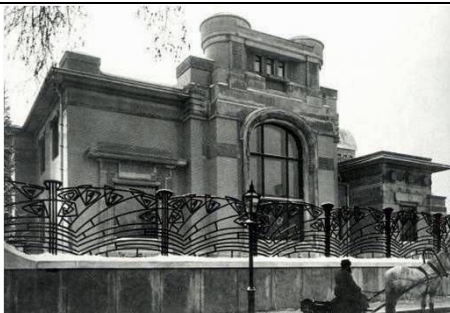
Рис. 7. Особняк Дерожинской, 1901–1902 гг. арх. Ф. О. Шехтель