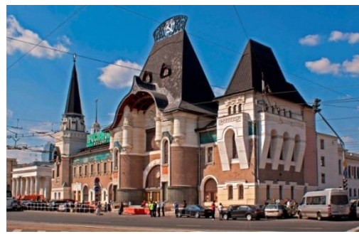
Рис. 6. Здание Ярославского вокзала, 1902–1904 гг., Ф. О. Шехтель