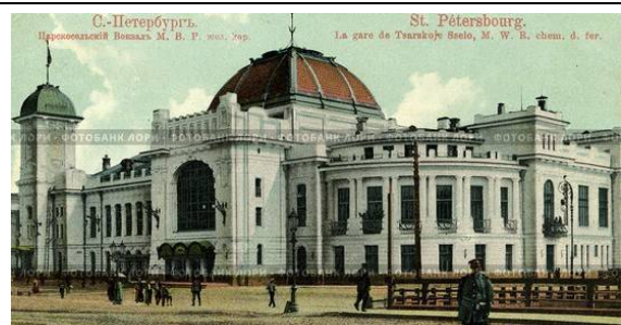
Рис. 4. Царскосельский (Витебский) вокзал, 1904 г. академик архитектуры С. А. Бржозовский