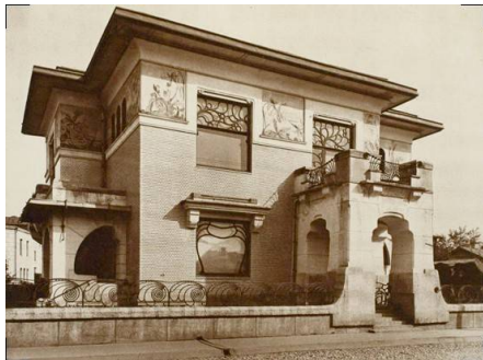
Рис. 5. Особняк Рябушинского, 1900–1902 г., арх. Ф. О. Шехтель