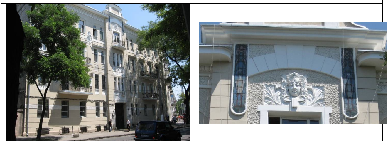
Рис. 11. Дом Пташникова, Старопортофранковская ул., 97, 1911–1912 гг., арх. М. И. Линецкий