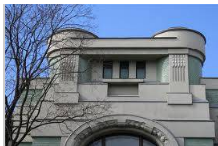
Рис. 8. Аттик