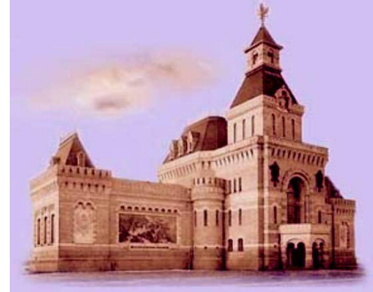
Рис. 2. Музей А. В. Суворова, 1901–1904 гг., арх. А. И. Гоген и Г. Д. Гримм