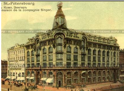
Рис. 3. Здание компании «Зингер», ныне Дом книги 1902–1904 гг., арх. П. Ю. Сюзор