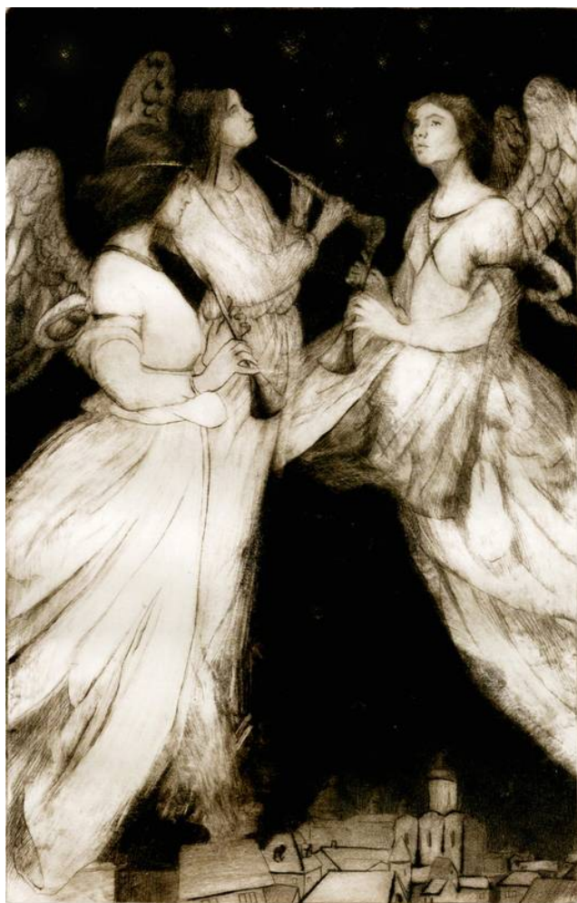
Рис. 1. «Рождество», Олейник О. А.

Инструменты для гравирования на оргстекле те же, что при работе на металле и дереве, — иглы, штихели, шабер, гладилка, те же и приемы работы. На оргстекле гравировать иглой довольно легко, только игла должна быть жёсткой, не пружинить. Иначе она срывается и чертит непредсказуемые линии. При работе под доску рекомендуется подкладывать серую бумагу. Это позволяет хорошо видеть и белые линии, наносимые иглой или штихелем, и черные линии рисунка. При работе иглой здесь, так же как и на металле, образуются барбы. Но в отличие от металла, на оргстекле они очень слабы, и обычно их сразу счищают с помощью проклеенной марли либо шабера.