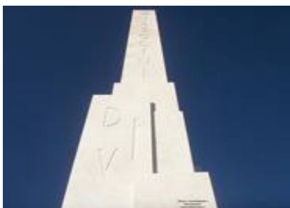
Рис. 5. Обелиск Муссолини около его Форума