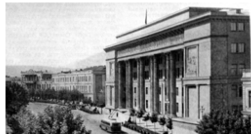
Рис. 29. Институт истории партии при ЦК КП Грузии в Тбилиси, 1938, арх. А. Щусев