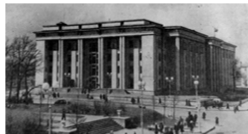
Рис. 30. Здание Невского райсовета, Ленинград, 1938–1940, Арх. Е. Левинсон, В. Щуко

Фасады большинства домов украшались рустами, несложными профилями, которые обрамляли дверные и оконные проемы, использовались декоративные карнизы [5, с. 158–168]. Наиболее типичными общественными сооружениями того периода были построенные по индивидуальным проектам Дома Советов и правительства, а также административные здания. Наиболее известные: Дом Совета Министров УССР в Киеве (арх. И. Фомин, П. Абросимов, 1934–1938) (рис. 23), Государственная библиотека им. В. И. Ленина в Москве (арх. В. Щуко, В. Гельфрейх, 1928–1941) (рис. 24), Дом Советов в Ленинграде (арх. Н. Троцкий, 1940) (рис. 25), Театр Советской Армии в Москве (арх. К. Алабян, В. Симбирцев,