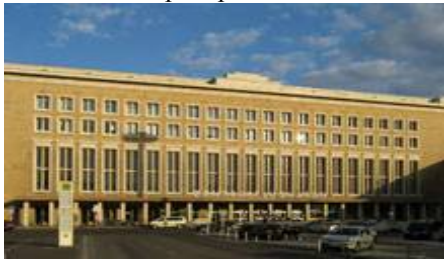
Рис. 17. Аэропорт Темпельхоф, Берлин