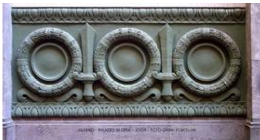
Рис. 1. Символы милитаристской мифологии на экстерьере дворца в Салерно

делу и великой общности. Наиболее наглядными возможностями обладают такие формы, как памятники, обелиски, монументы (рис. 5), триумфальные арки (рис. 6), тем более, если они развивают типологию мемориальных сооружений древности. Со времен древневосточных деспотий и античности торжественный монументализм архитектуры обеспечивался метрическим повторением однотипных элементов. Поэтому практика итальянского строительства 1930-х годов богата примерами портиков «большого ордера» (т. е. на всю высоту здания) (рис. 7). Одни из них составляли собственно главный фасад здания, будучи «приставленными» к нему, как театральная декорация. Другие акцентировали центральную часть фасада, третьи – лишь угловую часть или атриумы (рис. 8). Колонны портиков могли иметь «фантазийные» капители, либо завершались простой абаккой (Дворец Юстиции (о. Родос)). Ведущая тенденция заключалась в оперировании не колоннами, а пилонами, что соответствовало идеологической установке тоталитаризма на суровый аскетизм (самоограничение) форм, обладавших «прямым» действием на массовое сознание. Тенденция упрощения классических форм коснулась и арочных структур. В типично римской тектонической схеме сочетания арки и «накладной» стоечно-балочной системы исчезли, например, архивольты (обрамление арочного проема). Арочные портики вытягивались на всю высоту фасада, либо становились многоярусными [3, с.196–228].