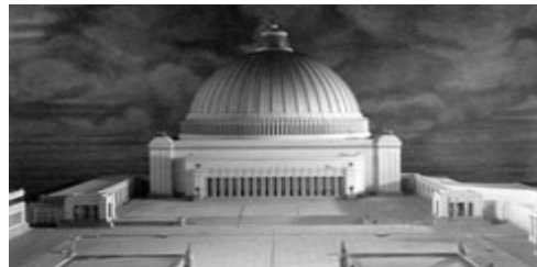
Рис. 20. Зал Народа в Берлине (модель)