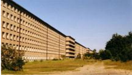
Рис. 19. Дом отдыха, Прора, о. Рюген