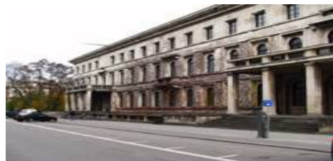
Рис. 13. Фюрербау, Мюнхен