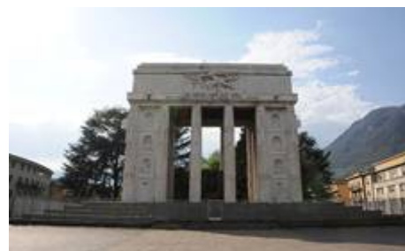
Рис. 6. Триумфальная арка в Риме