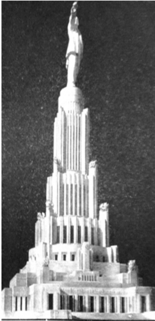
Рис. 27. Дворец Советов в Москве (модель), 1933–1935, арх. В. Гельфрейх, В. Щуко