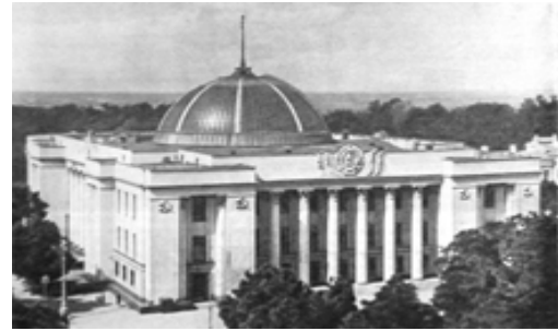
Рис. 28. Здание Верховного Совета УССР в Киеве, 1939, арх. В. Заболотный