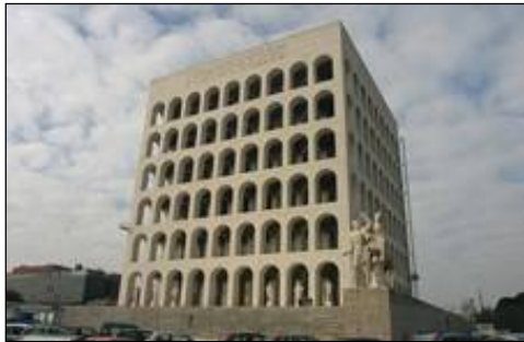
Рис. 9. Дворец Итальянской цивилизации в Риме