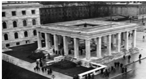
Рис. 11. Храм Почета в Мюнхене