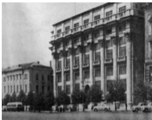
Рис. 21. Жилой дом в Москве, 1934, арх. И. Жолтковский

реформами. В 1932 г. были распущены все творческие объединения. Их заменили государственные союзы. Таким образом, все советские архитекторы (как, впрочем, и писатели, художники, музыканты) потеряли право на индивидуальное мнение. Одновременно, в 1932 г. Сталин лишил всех архитекторов права на частную практику. Они все стали чиновниками, служащими в тех или иных государственных учреждениях и потеряли, таким образом, право на индивидуальное творчество. Создание мощной экономики – фундамента построения социалистического общества – была той базой, на основе которой осуществлялась широкая программа преобразования старых и строительства новых городов. В Москве жилищное строительство размещалось в основном на реконструируемых магистралях (рис. 21). Так как архитектура жилых домов стала определять облик центральных городских магистралей и новых районов города, изменилось и отношение к их архитектурно-пространственному решению (рис. 22).