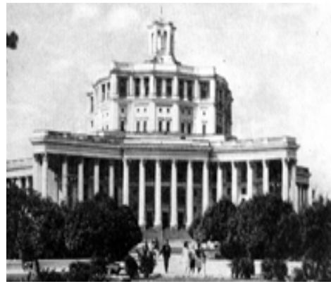
Рис. 26. Театр Советской Армии в Москве, 1934–1940, арх. К. Алабян, В. Симбирцев