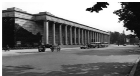
Рис. 12. Дом немецкого искусства в Мюнхене