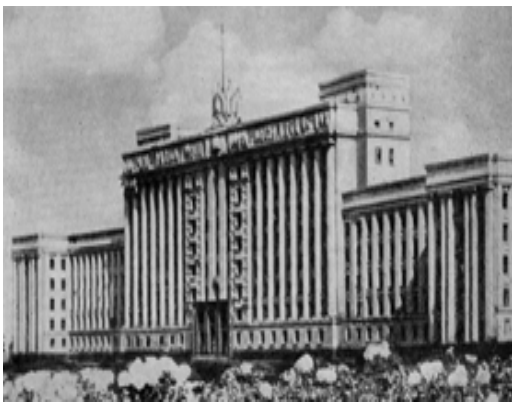
Рис. 25. Дом Советов в Ленинграде, 1940, арх. Н. Троцкий