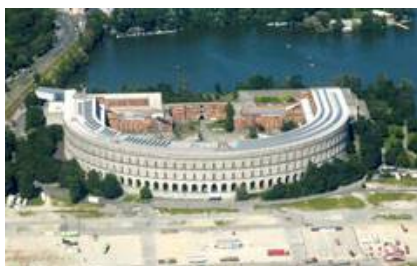
Рис. 15. Зал партийных конгрессов