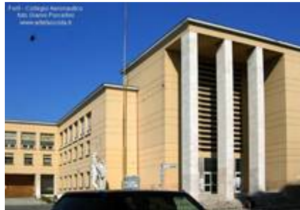
Рис. 8. «Большой ордер» на угловой части здания