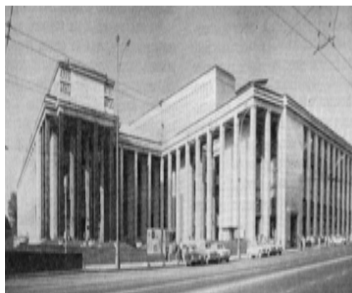
Рис. 24. Государственная библиотека им. В. И. Ленина в Москве, 1938–1941, арх. В. Щуко, В. Гельфрейх