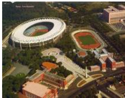
Рис. 10. Форум Муссолини в Риме

Своеобразным символом эпохи стал Дворец итальянской цивилизации в Риме (арх. Джованни Гуэррини, Бруно Ла Падула, Марио Романо, 1938–1940 гг.) (рис. 9). Многообразие арочно-ярусных систем включало в себя также архитектурные образы венецианских дворцов и «прямоугольные» вариации ярусных композиций. Монументальные порталы, как и портики, часто занимали всю высоту фасада. Их представительная значительность подчеркивалась обрамлением.