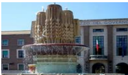
Рис. 3. Скульптура прославления труда и урожая