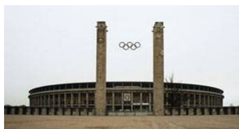
Рис. 16. Олимпийский стадион, Берлин