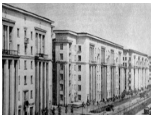
Рис. 22. Жилой дом в Ленинграде, 1937–1940, арх. Е. Левинский, И. Фомин