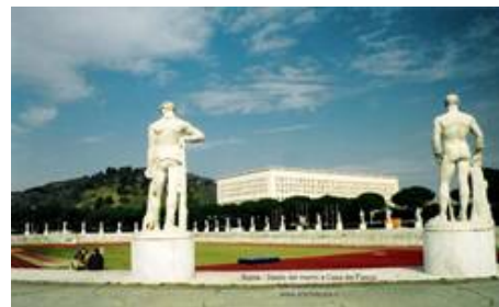
Рис. 2. Скульптуры на аллее к Форуму Муссолини