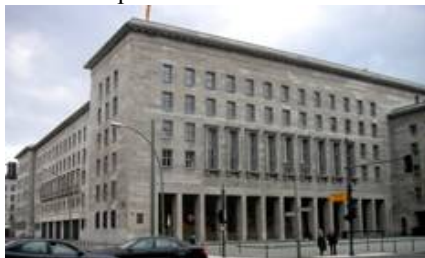
Рис. 14. Рейхсминистерство авиации, Берлин