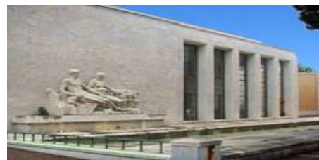
Рис. 4. «Большой стиль» на экстерьере общественного здания