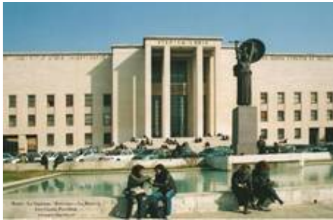
Рис. 7. Портик «большого ордера»