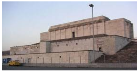
Рис. 18. Трибуна Цеппелинфельд, Нюрнберг